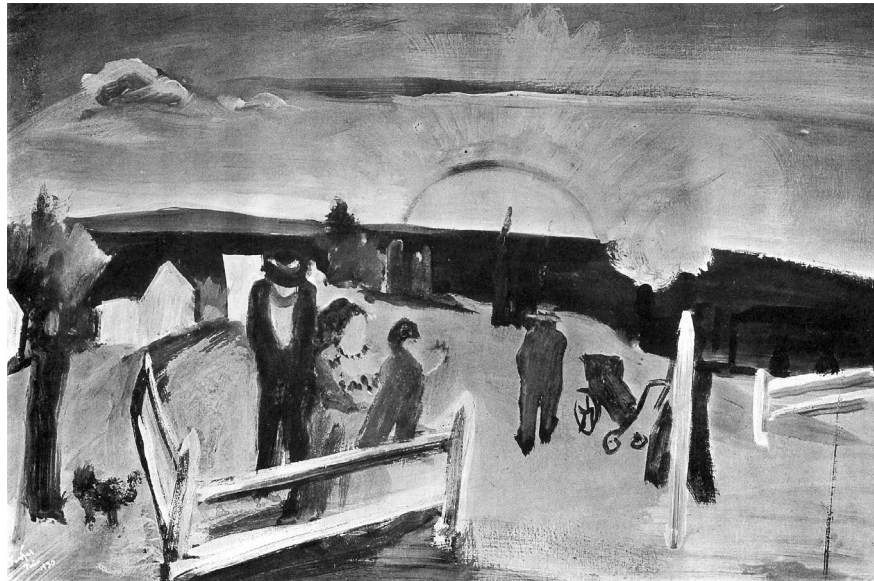
Farkas István: A nap, 1930. Tempera, fa, 55 x 80 cm. Lappang. Repr. André Salmon: Etienne Farkas . Paris, 1935. 27.

koncepciója híján csak egyöntetűen lehet. E logika hatálya alól pedig természetesen az irodalom sem mentesül – ezzel függ össze a szöveg célközönségének problémája is, amely talán minden kérdésnél több bonyodalom forrásának bizonyult a recepcióban. E tanácstalanság, úgy vélem, a legkevésbé sem véletlen – a felmerült lehetőségek (a megszólított a meg nem született gyermek, Isten, egyedül maga B., valamiféle olvasóközönség) ugyanis valóban mind felbukkannak a Kaddis egy-egy pontján, ám ezek egyike sem vonul végig következetesen a szöveg egészén, némelyik pedig önmagát is érvényteleníti (sem a gyermek, sem Isten nem létezik a szöveg világában); a bizonytalan („mindegy: minek, mindegy: kinek”) és paradox („mindenkinek és senkinek”) megfogalmazások pedig explicite is jelzik, hogy a szöveg megakadályozni igyekszik, hogy bármiféle egyértelmű kommunikációs helyzet részeként lehessen értelmezni. Mindez ismét csak B. elképzeléseit exponálja, aki szerint az írásnak van oka (a lét legvégső magját képező személytelen, tiszta eszme által az emberre mért „vallási feladat”) és van funkciója (a sírás, vagyis a saját élet tönkretétele), de hangsúlyosan igyekszik eltörölni-elmosni bármilyen arra vonatkozó jelet, hogy esetleg célja is lenne – hiszen azzal óhatatlanul az elutasított világban kellene helyet találnia.