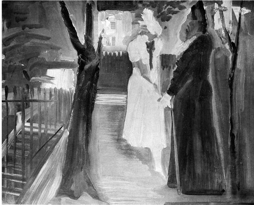
Farkas István: Itáliai emlék, 1931, tempera, fa, 64 x 85. mgt. Repr. Kihűlt világ , 2019 (kat.) 297.

megkülönböztetett olvasásmódja bizonyos értelemben nem szétválasztható: ahhoz, hogy B. életéről bármit gondolhassunk, az őt mozgató filozófiát kell megértenünk, ahogy azt a regény szövegében megfogalmazni próbálja. Ezt a szöveget B. egy „lekerített, üvegekemény tárgy”-hoz hasonlítja; 4 az én kérdésem az lesz, valóban olyan tömör és transzparens-e, mint ez a kép sugallja. Dolgozatom módszertani alapját Fredric Jameson ideológiakritikája képezi, aki szerint az ideológia elméletének tárgyai nem hamis tudatok, hanem strukturális korlátok és retorikus beszegések; 5 a B. által megfogalmazott szöveg jobb megértése érdekében tehát az alábbiakban azokat a pontokat próbálom meg kitapintani, ahol az beleütközik saját határaiba – természetesen nem egy pozitíve hozzáférhető valóság vagy totalitás, csupán az összefüggések egészlegességének rekonstruálására törekvő szándék jegyében.