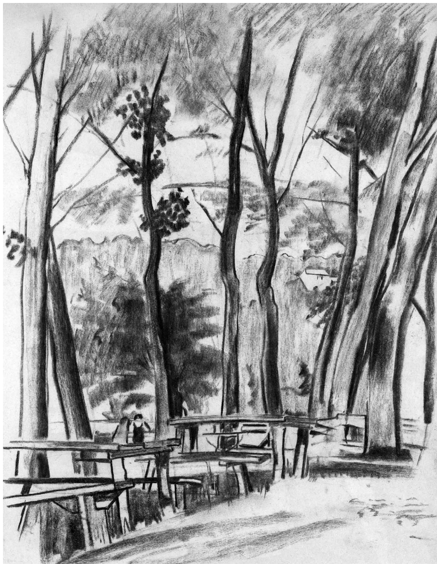
Farkas István: Fák, 1926–1928, papír, szén, 490 x 360 mm, mgt.

a neves költőnek és esztétikusnak, aki most Farkas Istvánnal ad ki egy albumot. A napilapokban megjelent híradás szerint nem vers-illusztrálásról van szó, hanem egy egész különös új műfajról: Farkas István tíz kép-reprodukcióját André Salmon a szó művészetével „magyarázza”. Salmon verses prózái voltaképpen a képekhez applikált „illusztrációk”. Salmon elismert és kellőképp méltányolt neve, művészi egyéniségének súlya valójában Farkas István művészetének approbálása.