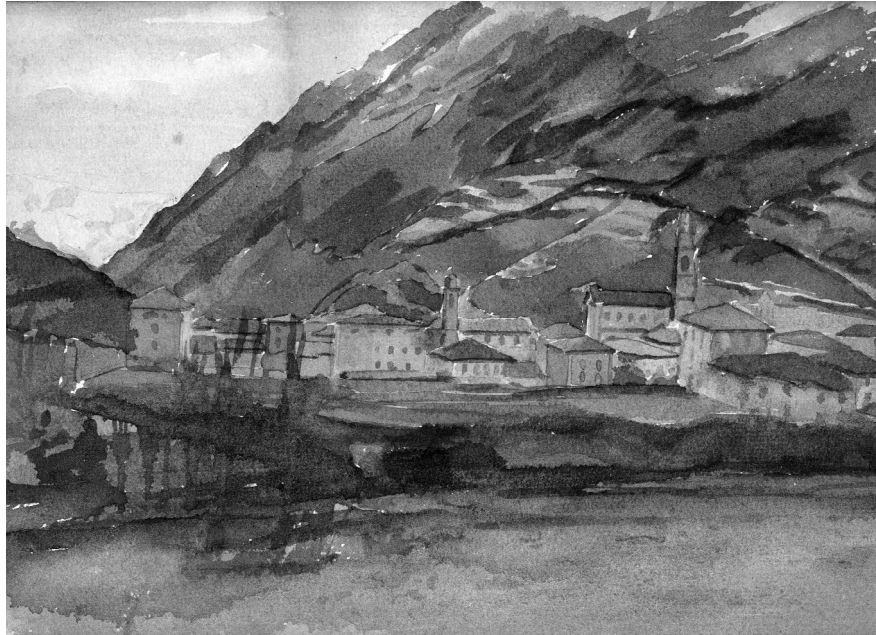
Farkas István: Dalmát táj, Bordighera, p.a. 1926. jn. 118 x 131, mgt.

Nemes Marcell az európai hírnű műgyűjtő nincs elragadtatva a mai magyar festők alkotásaitól. Hosszú külföldi tartózkodás után ismét Budapestre érkezett Nemes Marcell, a világhírnű műgyűjtő. Néhány napra jött csak látogatóba, ám mikor megérkezett, annyi munka, annyi elintéznivaló várta itthon, hogy meghosszabbította tartózkodását. Gellért-szállóbeli lakosztályának kilincset (ugyanabban a lakosztályban lakik, amelyben pesti tartózkodásakor Rabindranath Tagore 15 lakott), egymás kezébe adják a budapesti művészek. Telefonja szünet nélkül cseng. Programokkal, tervekkel, kérésekkel halmozzák el. Támogatást, közbenjárást, véleményt kérnek tőle. Budapestre – szokásos európai művészeti körútja után látogatott el és azért kerestük fel, hogy közismert szaktekintélytől halljuk meg az eseményeket, amelyek ma Európa művészetét érdeklik.