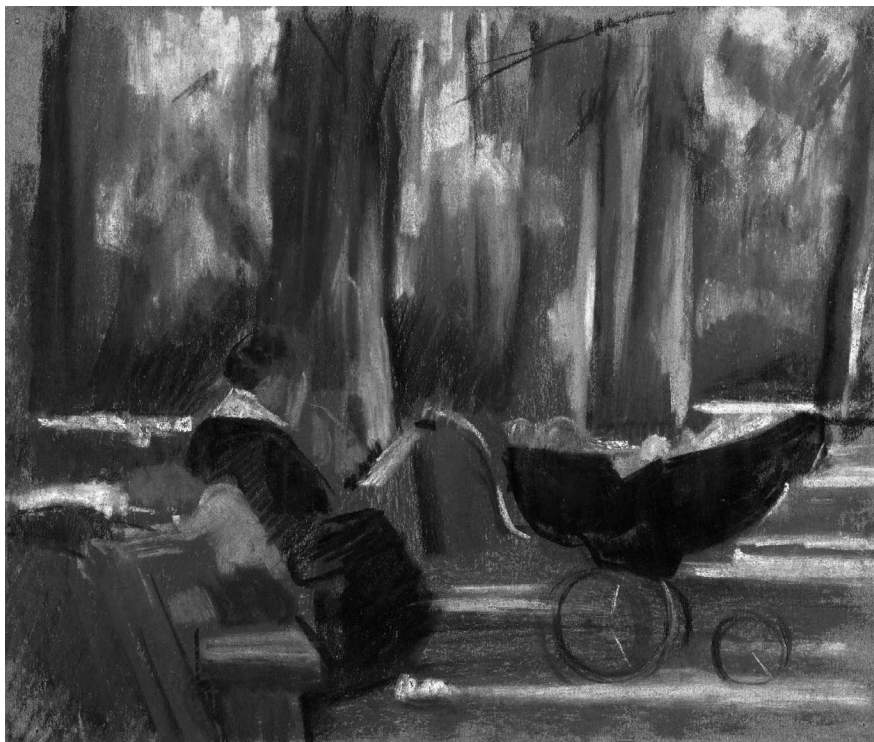
Farkas István: Olvasó nő babakocsival, 1929, papír, pasztell, 260 x 290 mm, Kecskeméti Katona József Múzeum, ltsz: 84.84. © Kecskeméti Katona József Múzeum

Magyar festő Párizsban – Farkas Istvánról. [...] Farkas Istvánnak sok egyéb lehetőséget megadott volna a sors. Miért tehát és micsoda megszálltság hatása alatt, hogy a dolgok legnehezebb végét fogja meg, elhárítva mindent, ami könnyű, ami kínálkozó és bányássza inkább a ritkát, a maga lelki asszonáncait a széppel, az összefüggéseit minden más világokkal és e világok spektrumát az ő lelki prizmján keresztül.