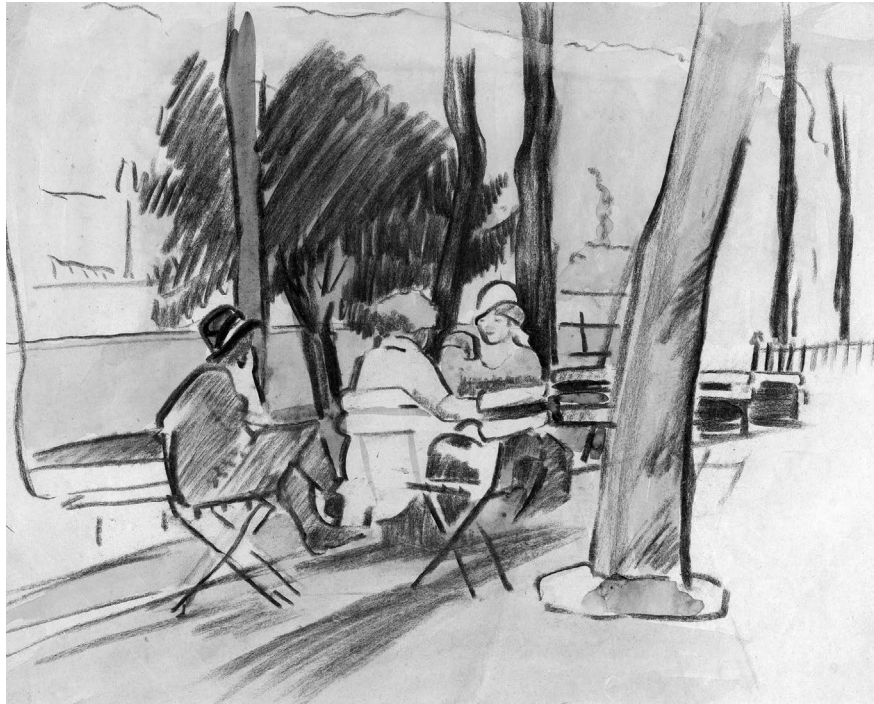
Farkas István: Parkban, 1928 körül, karton, pasztell, 250 x 350 mm, mgt.

- A Salon-beli kiállítás, rám nézve még jelentősebb sikere, hogy megtörtént velem az a Párizsban rendkívül szokatlan megtiszteltetés, hogy egy neves műkereskedő jött fel műtermembe, felszólítva, hogy rendezek nála kiállítást. Aki ismeri a párizsi viszonyokat és azt, hogy műkereskedőnél tartott kiállításoknak fix áruk van, az tudja csak méltányolni, hogy mit jelent egy Párizsban élő festő számára, egynek az ötven-ezer közül, ha műkereskedő meglátogatja és felszólítja kiállításra.