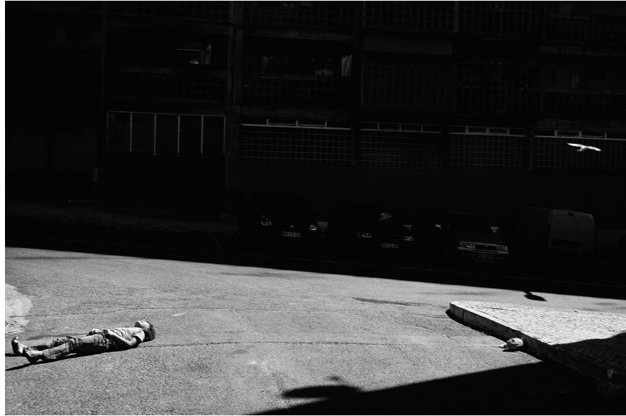
XXIII. Vancsó Zoltán: Lisbon, Portugal, 2014 | from the upcoming series Haikus | A Haikus című készülő sorozatból. © Vancsó Zoltán © HUNGART, 2016.