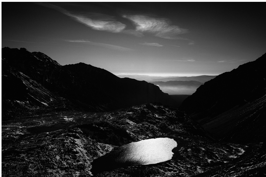
XX. Vancsó Zoltán: Tatras, Slovakia, 2014 | from the upcoming series Haikus | A Haikus című készülő sorozatból. © Vancsó Zoltán © HUNGART, 2016.