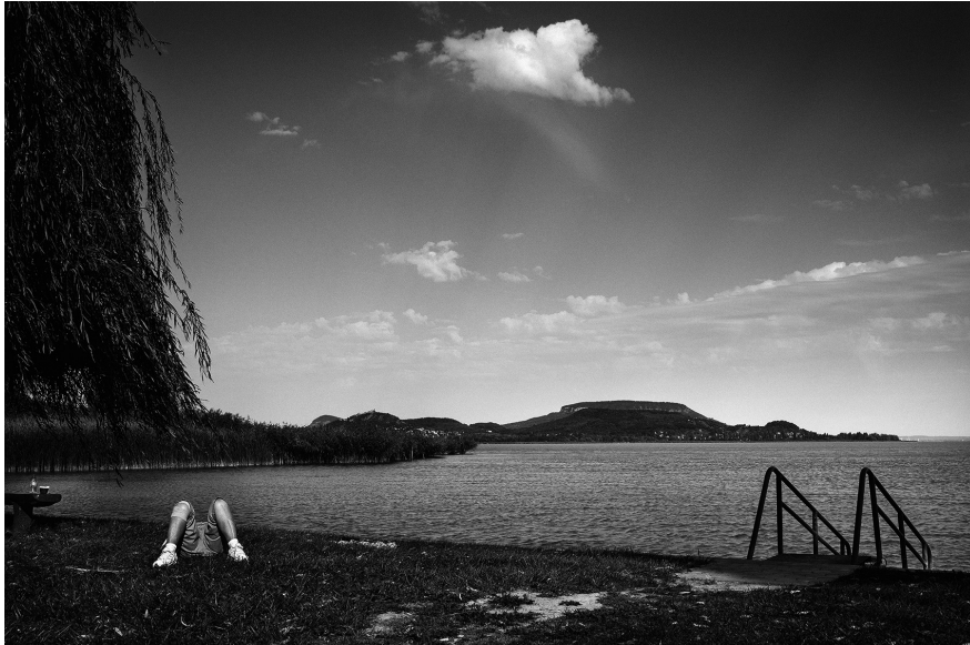
XXII. Vancsó Zoltán: Balatonederics, Hungary, 2015 | from the upcoming series Off Season - Metamorphosis | Az Utószezon - Metamorfózis című készülő sorozatból. © Vancsó Zoltán © HUNGART, 2016.