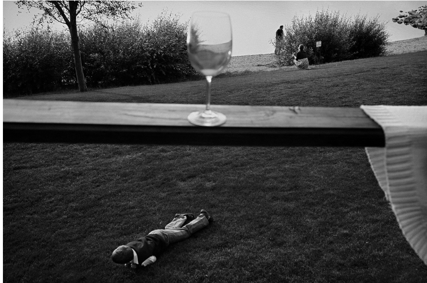
XVII. Vancsó Zoltán: Budapest, Hungary, 2012 | from the series Between Nothingness and Eternity | A Nemlét és örökkévalóság között című sorozatból. © Vancsó Zoltán © HUNGART, 2016.