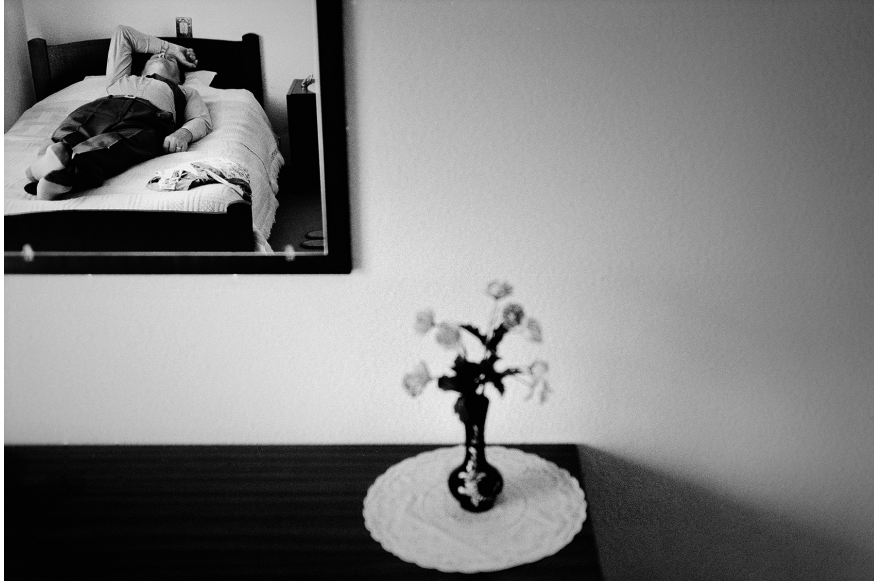
XXIV. Vancsó Zoltán: Fatima, Portugal, 2003 | from the series Still Movies – Silent Stills | Az Állófilmek – Csendes képek sorozatból.