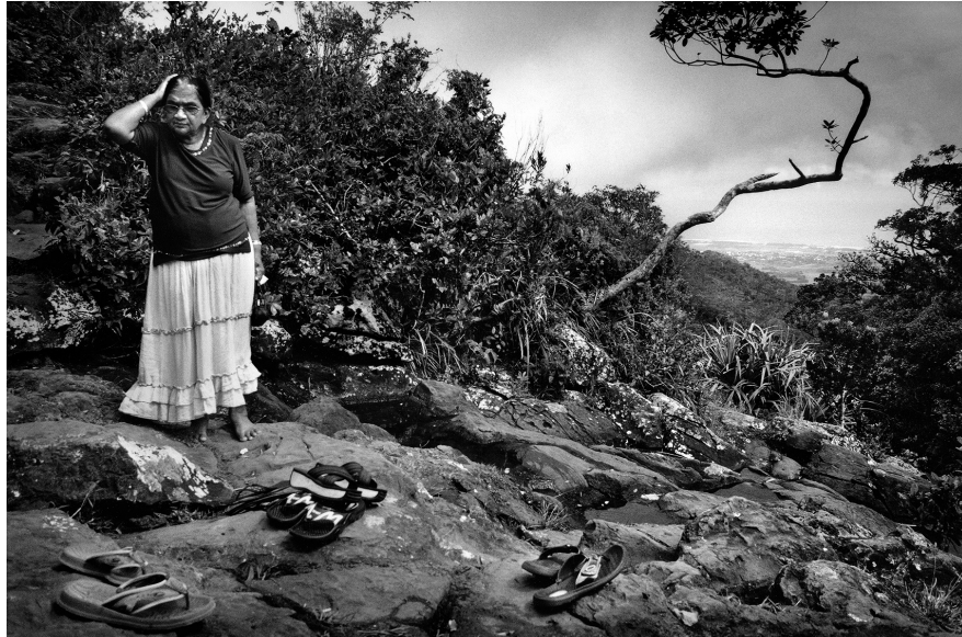
XIX. Vancsó Zoltán: Black River Gorges, Mauritius, 2008 | from the series Unintended Light | A Szándéktalan fény című sorozatból.