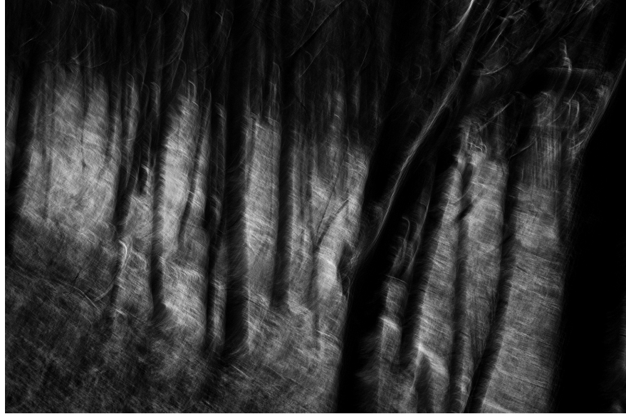
XXV. Vancsó Zoltán: Pilis, Hungary, 2010 | from the series Landslides - Exploring the Void | Az Álomvölgy - Az üresség felfedezése című sorozatból. © Vancsó Zoltán © HUNGART, 2016