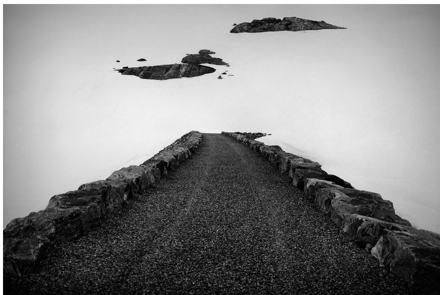
XXVI. Vancsó Zoltán: Unknown Place, Norway, 2000 | from the series Still Movies - Silent Stills | Az Állófilmek - Csendes képek című sorozatból. © Vancsó Zoltán © HUNGART, 2016.