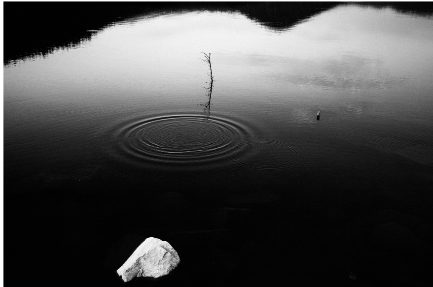
XXI. Vancsó Zoltán: Romania, 2009 | from the series Between Nothingness and Eternity | A Nemlét és örökkévalóság között sorozatból. © Vancsó Zoltán © HUNGART, 2016.