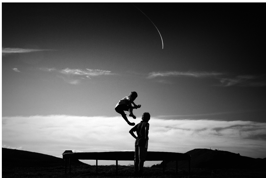
XXVIII. Vancsó Zoltán: Tirol, Austria, 2012 | from the upcoming series Haikus | A Haikus című készülő sorozatból. © Vancsó Zoltán © HUNGART, 2016.