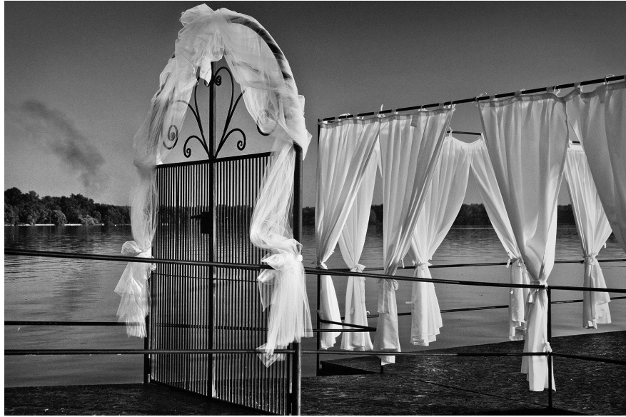
XXVII. Vancsó Zoltán: Tata, Hungary, 2010 | from the series Between Nothingness and Eternity | A Nemlét és örökkévalóság között című sorozatból. © Vancsó Zoltán © HUNGART, 2016.