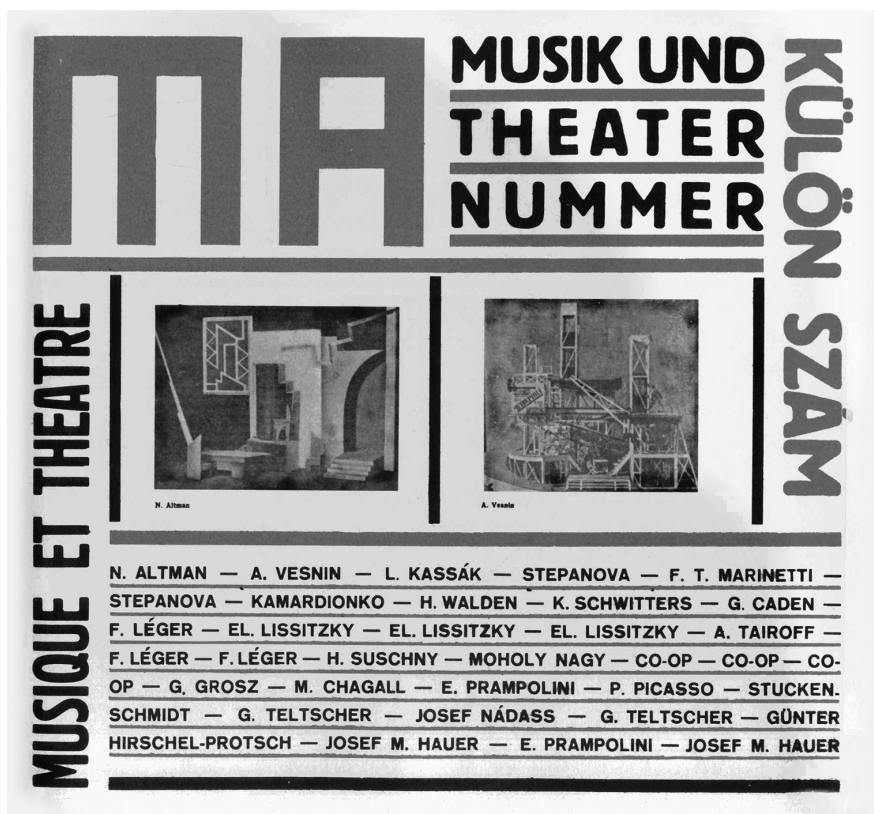
3. MA. Musik- und Theaternummer, IX. évfolyam, 8. szám. 1924. Szerk. Kassák Lajos. Címoldal Natan Altman és Alexander Vesnin orosz tervezők alkotásaival.

egyaránt rendkívüli fontossággal bírt. A színházi elméletek közül azokat helyezték előtérbe, amelyek ennek a két szempontnak az egyensúlyán alapuló szintézist valósították meg. 19 Mácza legfontosabb elméleti szövege 1919-ben, majd átdolgozott formában 1921-ben „Teljes színpad” címen jelent meg a MA-ban. 20 Az expresszionista színházat tekinti alapvető ideának, ezenbelül a kollektivitás és a tömegproblémák érdekelték. Ezekben a részterületeken belül fordult a tömegszínpadok és a teatralista szempontok felé is, és jutott el Meyerhold és Tairov munkásságának méltatásáig. Meyerhold esetében az lesz számára igazán fontos, hogy ő a színpad fő törvényévé a mozgást tette, és a színjáték tömegakcióvá tételére törekedett. Tairoff, aki szintén