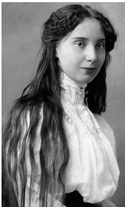
2. Czóbel Margit lánykorában, 1910 k. Kiss István fotográfiája, AVU SNG, Fond Mednyánszky, ltsz.: 20Fe-17-1 © Slovenská národná galéria, Bratislava

Ez volt tulajdonképpen a fő ok, és nem nagyon akaródzott kiállítani, mint inkább kihasználni a lehetőséget, amikor pénzem is volt stb., hogy néhány életnagyságú figurát befejezzek, és egyszer végre megbizonyosodjak róla, hogy ez is megy.