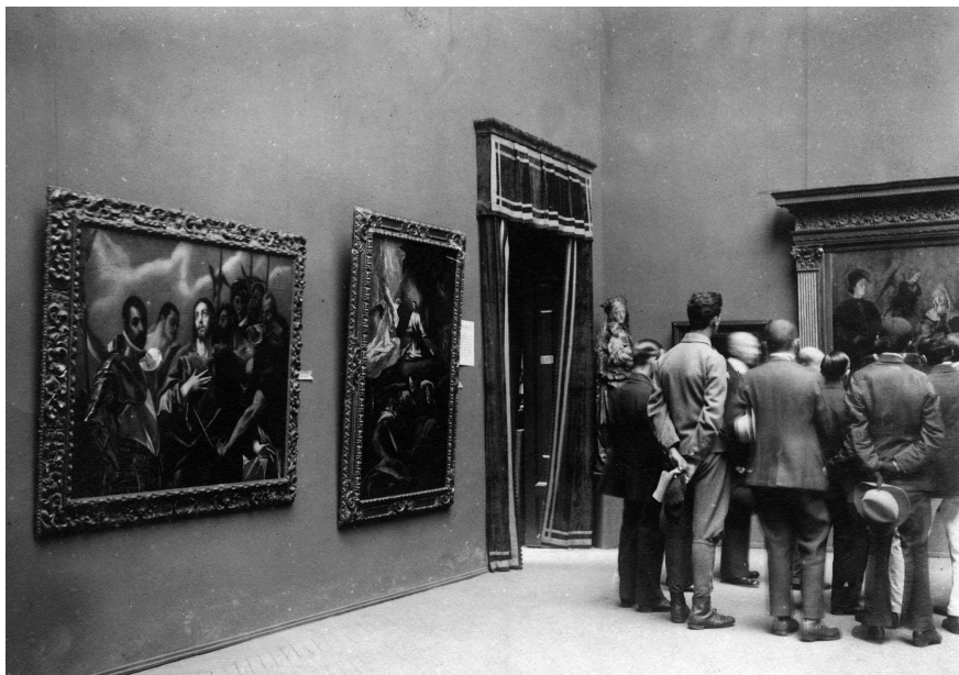
4. Részlet A köztulajdonba vett műkincsek első kiállításáról, az I. terem Greco műveivel, 1919. június 14.

államrendőrség politikai osztályán lefolytatott nyomozás azt állapította meg, hogy a „Pór Bertalan ellen emelt vád teljesen alaptalan”, s ezért az eljárást beszüntették. Ehhez képest Pór visszaemlékezéséből is tudjuk, hogy egy időben a Pogány Kálmán vezette művészeti és múzeumi direktórium festészeti szakosztályát vezette, mely tisztet elsősorban a meglehetősen harcos Uitz hathatós támogatásával kapta meg, miután Berény a művészkataszter összeállítása körüli perpatvar során lemondott erről a tisztségről. 24 Pór aztán – Tihanyi segítségével – nagy elánnal vágott bele a kataszter kényes ügyének megoldásába, melynek elsődleges célja az volt, hogy kiválasszanak 150 művészt, akiket jelentősebb havi fizetéssel megszabadítanak a műpiacra való termelés kényszerétől. (A kataszter összeállításának nagy figyelmet kapó része volt egy központi kérdőív kitöltetése is, melynek utolsó kérdése így szólt: „Melyik öt művészt tartja a modern festészet legjobbjának?” – A Pesti Futár 1919. május 2-i cikke szerint ez a kérdés izasztotta meg a legjobban a piktorokat: mindenki igyekezett ugyanis a vezetőség radikálisan modernnek vélt ízlését kitalálni. „Cézanne-t mindenki beírja, természetesen régi ellenségei is. Egyesek még messzebb szeretnének menni a hízelgésben: a zsűrit szeretnék beírni. De ez talán feltűnő volna.” 25 Mai tudásunk szerint egy