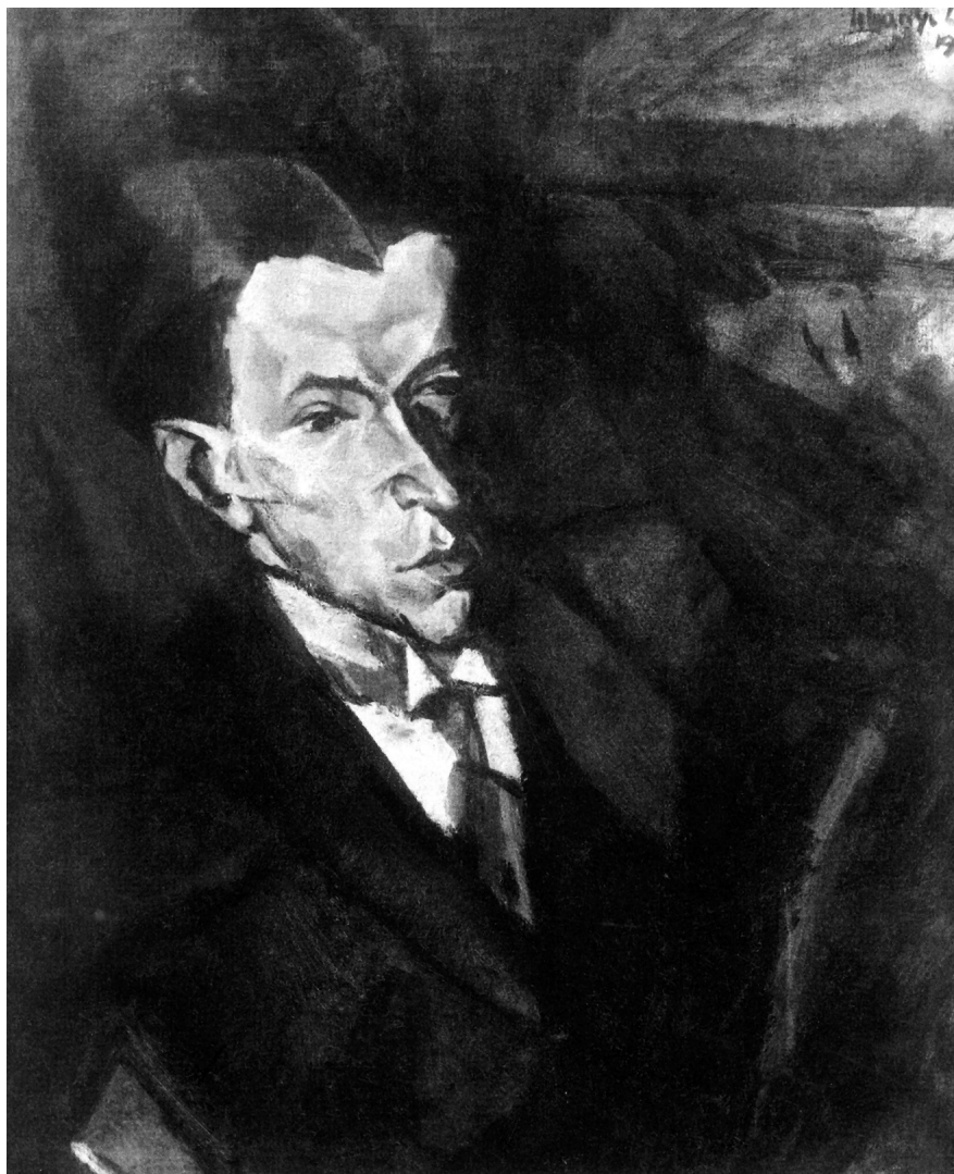
5. Tihanyi Lajos: Szamuely Tibor arcképe, 1913. Lappang.

kezdését kérő levélből pontosan ismerjük Berény szerepét a művészeti direktórium festészeti szakosztályának élén, melyet március 27-től lemondásáig, május 20-ig töltött be, ez időbeli díjazását, s a már korábban általa alapított, városmajori festőiskola szocializálásának történetét. E levélből az is kiderül, hogy a Közoktatási Népbiztosságtól egy monumentális méretű mű megfestésére kapott megbízást, mely a tervek szerint - elkészülte után - egy iskola könyvtárában kapott volna helyet.