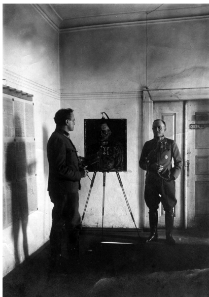
4. Pór Bertalan Szurmay Sándor hadügyminisztert festi, 1916.

Pór Bertalanról elképzelhető, hogy az ötvenes években úgy érezte, testileg-lelkileg igencsak megszenvedte az első világháborút – miként ez Oelmacher Anna 1952-ben írt, fentebb idézett szövegéből kiolvasható –, ám a róla szép számmal fennmaradt katonaképek 15 éppenséggel nem ezt sugallják. Sokkal inkább úgy tűnik, hogy szívesen pózolt egyenruhában családja körében (3. kép), fiatal hölgyek társaságában, a festményei előtt otthon, vagy épp kivont karddal a Százados úti művésztelepen. A hadiszolgálat hősie vagy gondtalanságot sugalló képeit is megőrizte: az egyikén lóháton feszít, a másikon a bajtársakkal pecázik, egy harmadikon csapatával ágyútalpat ülnek körbe, mintha csak valamely sportkör tagjai lennének. A legfontosabb dokumentumon pedig egyenesen Szurmay Sándor hadügyminisztert portrézza, ilyenformán aligha valószínű, hogy nehéz sorsa volt (4. kép).