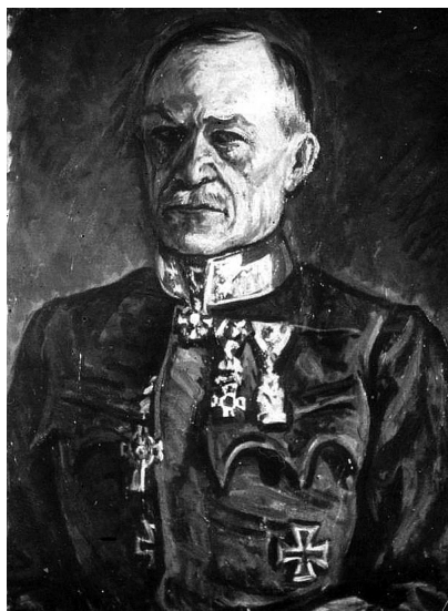
5. Pór Bertalan: Szurmay Sándor. Olaj, vászon. Korabeli fénykép, magántulajdon.

Márffy Ödön is mindent megtett azért, hogy az önkéntesi éveket minél gondtalanabbá tegye, és ha annyira nem is volt szerencsés, mint Orbán Dezső, panaszra neki sem igen lehetett oka. Mint láttuk – már bevonulásakor felettébb kedvező helyzetbe került, amit talán annak köszönhetett, hogy kis megszakítással másfél évtizede volt már hivatalnok a Budapest Fővárosnál, és pártfogójának tudhatta Bárczi István főpolgármestert. 20