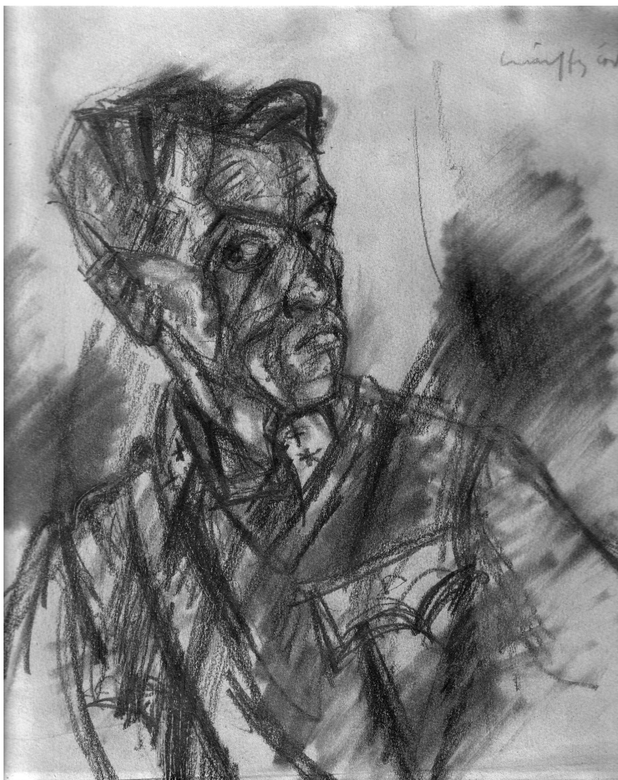
8. Márffy Ödön: Katonaruhás önarckép, 1915 körül. Ceruza, karton, 270 x 250 mm, PIM, ltsz.: 2011.52.1.

Júniusban már újra a Sajtóhadiszállás főparancsnokságán, Osztravában találjuk, ahol megismerkedik Mednyánszkyval. „Az első v[ilág]háb[orú] alatt én is, Rippl is hadifestők voltunk a Mährisch-Ostrau-ban, (Pozsony felett Morvaország), Mednyánszky is - mesélte évtizedekkel később Márffy - Itt voltunk beosztva a Sajtó főhadiszállásra. Csak sapka és karszallag meg igazolvány volt. Itt találkoztunk kb. havonta s innen küldtek ki bennünket a különféle frontokra. Itt mutattuk be a