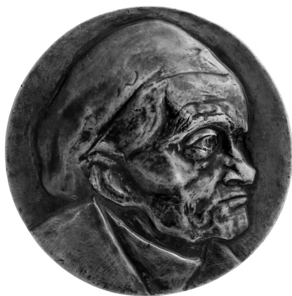
1. Ferenczy Béni: Wilde Richárdné. 1929. Átm.: 12,2 cm. Ltsz.: 70.26-P.

díványomon, ott mégis tűrhetőbb az éjszaka. Tyumpika kúrálja ki haladéktalanul a meghűlését, aludjon, sétáljon és olvasson, amennyit csak lehet, most nem kell szegénykének egy ideig harisnyát vásárolni.