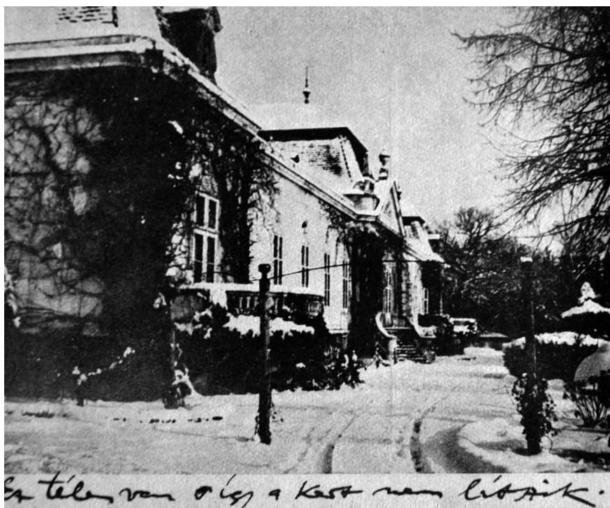
3. Karl Khuen-Belasi gróf grusbachi kastélya télen, 1920. Fotográfia, Wilde levelének mellékleteként.

Götzen) és gyerekeivel. 39 Holnap kezdődik a búcsú, mely ezen a környéken egy hétfőig szokott tartani. Azon kívül volt már két avatóbál nagy ivásokkal és tánccal. Itt a kastélyban is volt az ittlétem alatt két bál, amelyek ellen én azonban távollétemmel tüntettem. De gyakran vannak vendégek, lassankint megismerem már az egész volt osztrák arisztokráciát (Fürst Ratibor, Lippe, Khewenmüller, Graf Waldstein, Des Foures, Haugwitz, Fries, Mitrowski stb. megfelelő nőtagokkal; a jövő héten jön több napra Rothschild). Ha nagyon sokan vannak, tüntetni szoktunk és külön eszünk a titkárral – egy 28 éves volt főhadnagy jogász – és Rittmeister von Schützelvel, aki a grófnak volt tisztvárosa. 30 éves, és most itt a birtokon mezőgazdaságot tanul. Ezek az állandó társaságom olyankor is, ha a gróf nincs itthon, igen kedves emberek, különösen a Rittmeister (ő vitte el tegnapelőtt a levelemet Bécsbe). Sok érdekeset tanulok ebből a nekem idegen társasággal való érintkezésből, kellemes az, hogy az arisztokraták mind igen jó modorú emberek, de vannak köztük igen jófejűek is. A gróffal abszolút szabadon beszélgetek mindenről, inaktív monarchistának vallja magát ugyan az állásánál fogva, de annyira ultramodern, hogy minden álláspontot megért és minél radikálisabb annál jobban tisztel („ein monastischer