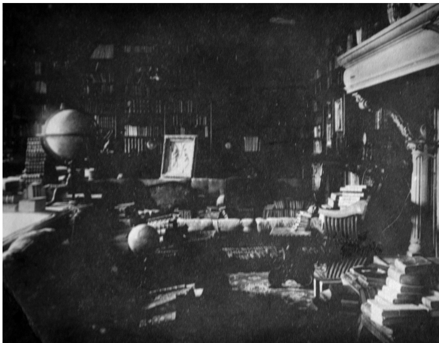
4. Karl Khuen-Belasi gróf dolgozószobája a grusbachi kastélyban, 1920. Fotográfia, Wilde levelének mellékleteként.