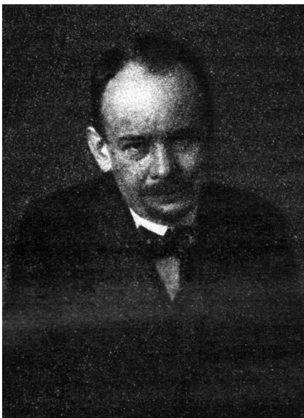
6. Dvořák halála előtt. Repr. Dagobert Frey: Max Dvořák zum Gedächtnis. Wien, 1922. 1.

tünk a gróffal Grusbachból a gyászmisére az első vonattal, úgy, hogy a pályaudvarról még éppen elértünk a Jezsuita-templomhoz - Dvořák legkedvesebb bécsi templomához - 11 órára a gyászmiséhez. (7. kép) De ehhez nekem 3 órakeret kellett felkelnem és 2 órát menni kocsin éjszaka; délután az özvegnél vacsoráig, este Swob[odá]nál 1 óráig - így nagyon fáradt voltam már és nem is jutott időm az írásra. Különbösen is mindent, ami az utolsó 10 napban történt velem, nem tudnám leírni még magamnak sem, édes Otthoniak, majd ha egy hónap múlva hazamegyek, szóval fogok elmondani mindent. Olyan csodálatos idő volt ez - Isten akarata volt, hogy ezek történjenek velem.