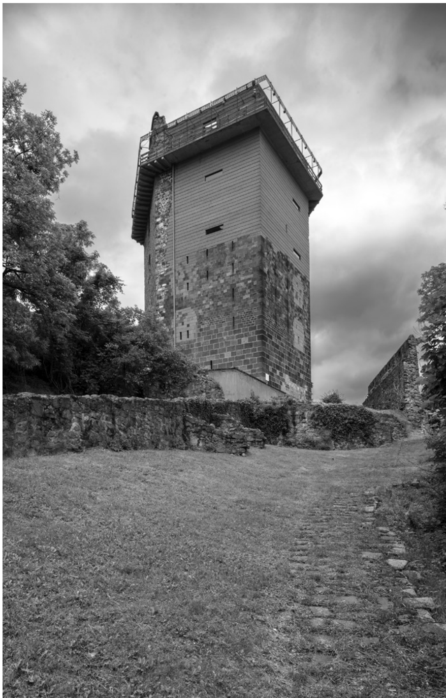
5. Visegrád, Salamon-torony, 2022