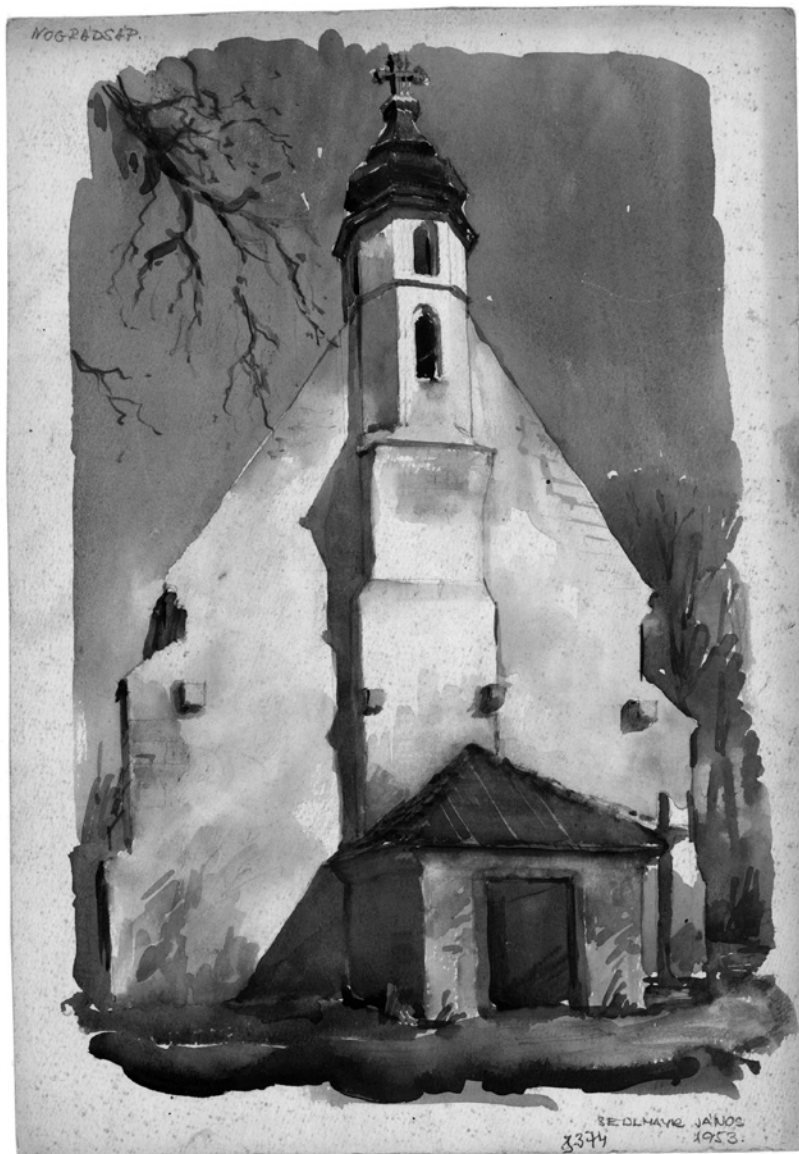
9. Nógrádsáp, római katolikus templom, Sedlmayr János akvarellje, 1953 © MÉM MDK, Tervtár, ltsz. R 8374

mást nem, évente egy-egy kisebb templom helyreállítását csak megcsináltam. Nagyon szerettem a kis templomok helyreállítási munkáit, de olyan volumenben, mint korábban, nem tudtam dolgozni. Ezért is siettem nyugdíjba, mert aztán nyugdíjasként (akkor alakultak ki az új, szabad tervezési adózási rendszerek) megint legalább annyit dolgoztam, mint amennyit korábban.