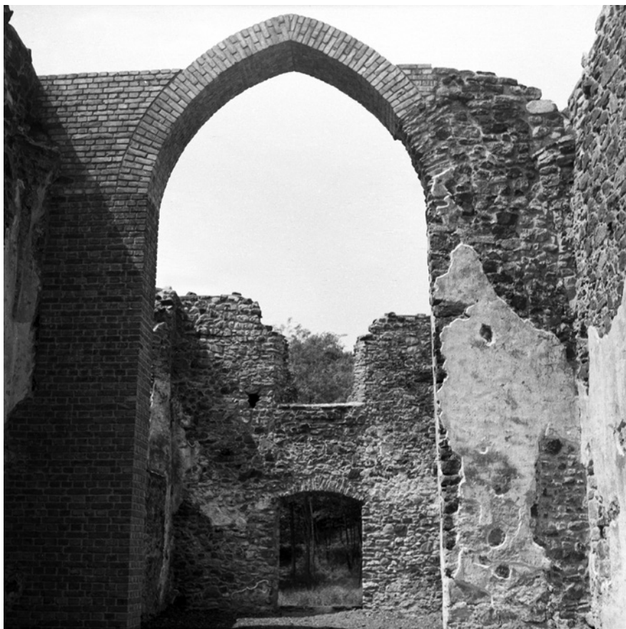
8. A salföldi pálos templomrom diadalíve, 1964