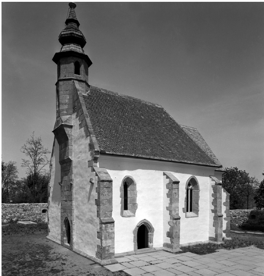
10. Nógrádsáp helyreállított római katolikus temploma délnyugat felől, 1965