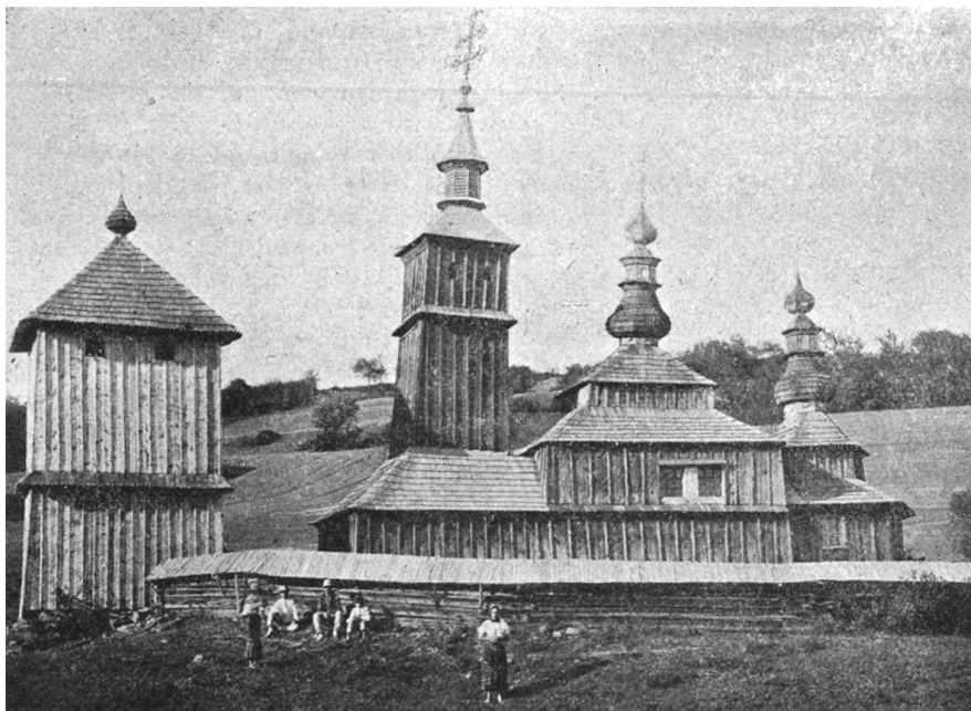
5. A héthársi fatemplom a háború előtt és az orosz betörés után. Divald Kornél: Pusztuló fatemplomok. Élet , 1918. május 26. 521.

lag gyors egymásutánban, mindössze nyolc év alatt a magyar művészettörténetnek még két áttekintése is született, az egyik Péter András: A magyar művészet története . Budapest, 1930. 2 köt., a másik Hekler Antal: A magyar művészet története . Budapest, 1935.) Divald könyve a magyarországi művészet legfontosabb alkotásainak korrekt, nem különösebben egyéni felsorolása, ugyanazokkal az elfogultságokkal, amelyeket eddig is megfigyelhettünk. Majdnem kétharmadát a középkor tölti ki, ennek szinte egyhatoda a szárnyasoltárok, a barokk már rövid, alig több mint a terjedelem tizede, és a fejlődést a szintén rövid klasszicizmussal be is fejezi. A közelmúlt és a jelenkor tudomásul nem vétele ugyancsak meglepő egy olyan művészettörténész esetében, aki tárlati kritikákkal kezdte, és ezekhez később sem maradt hűtlen. Kicsivel később jelent meg egy ugyancsak szép illusztrációkkal kísért könyve az Árpád-házi magyar szentekről. 31 Nemzeti szentjeink történeteit mondja el benne, bőségesen merítve a hozzájuk fűződő legendákból.