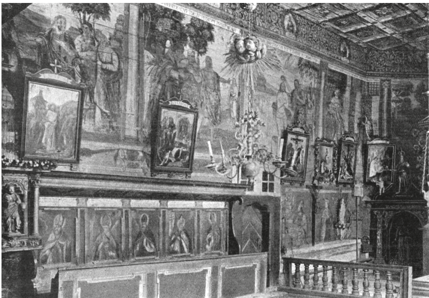
6. Az oravkai templom belseje. Divald Kornél: Pusztuló fatemplomok. Élet , 1918. május 26. 522.

fordul elő, ehelyett a „szerb” szerepel. A „katholikus” írásmód is már archaizmus a huszadik század előrehaladtával. Stoss keresztnevének állandóan használt magyar változata tekinthető tudatos állásfoglalásnak, viszont a „Donner Ráfael György” és a „Kracker Lukács János” már egyszerűen képtelenség, a 19. században megjelent könyveken olvasható „Hugo Viktort” és „Verne Gyulát” juttatja eszünkbe.