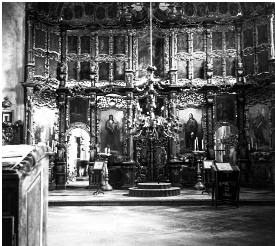
2. A bajai szerb templom ikonosztáza, 1960

BZs: Melyik munkáidra vagy a legbüszkébb? Melyek voltak számodra a legkedvesebbek?