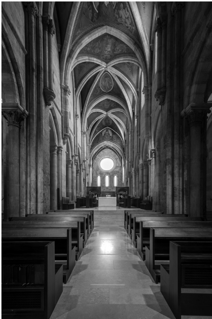
6b. A pannonhalmi bencés apátsági templom a John Pawson-féle átépítés után, 2020 © MÉM MDK, Fotótár, ltsz. 243.778D