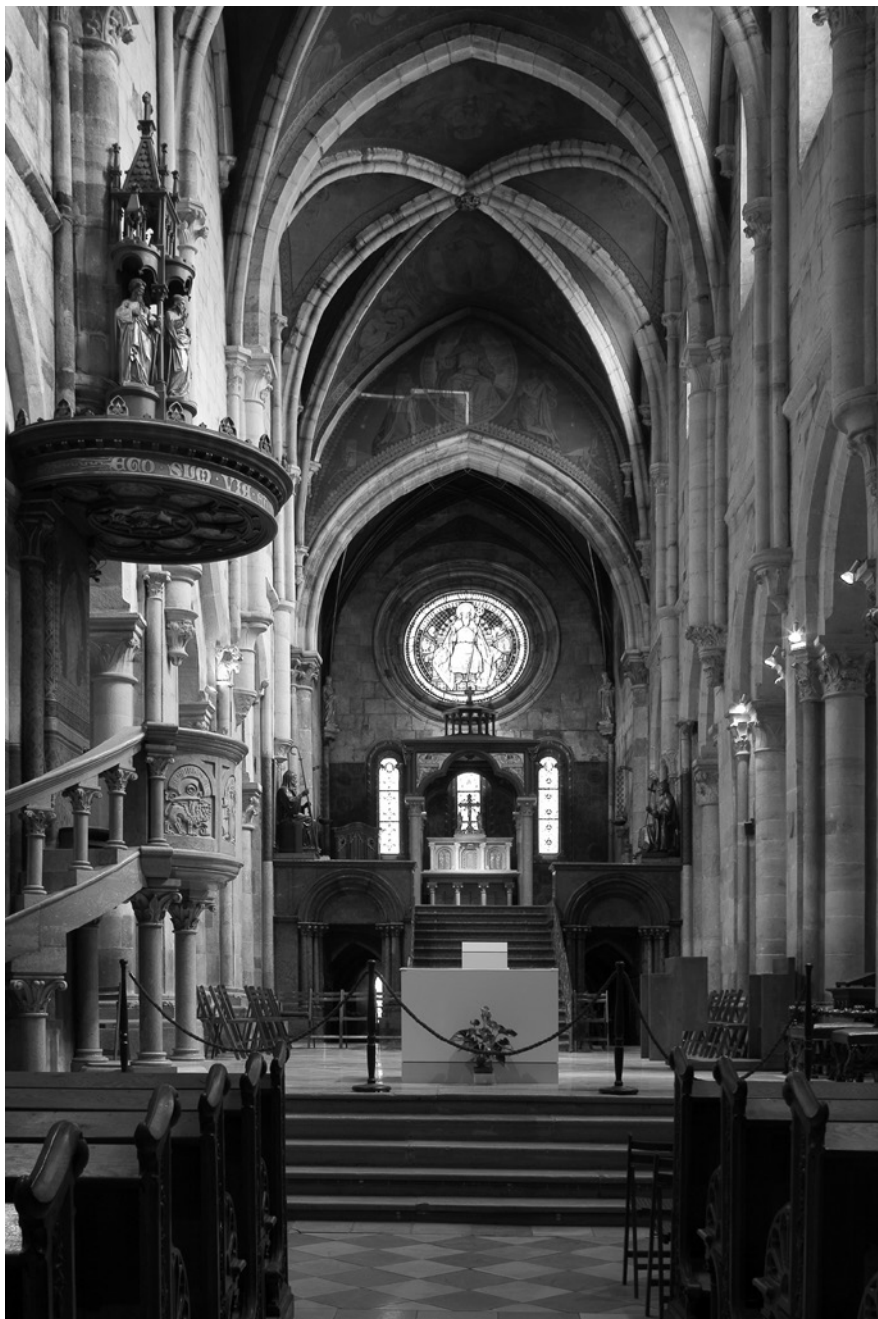
6a. A pannonhalmi bencés apátsági templom a John Pawson-féle átépítés előtt, 2011 © MÉM MDK, Fotótár, ltsz. 243.777D