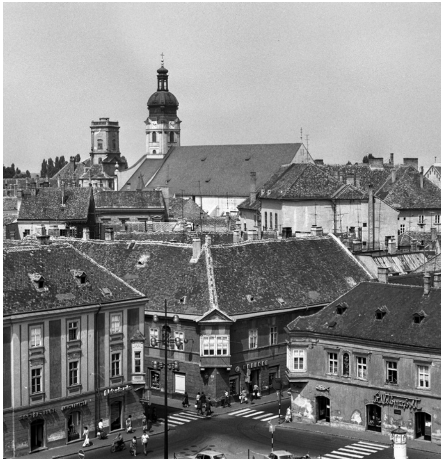
9. A győri belváros – műemléki jelentőségű terület, 1977