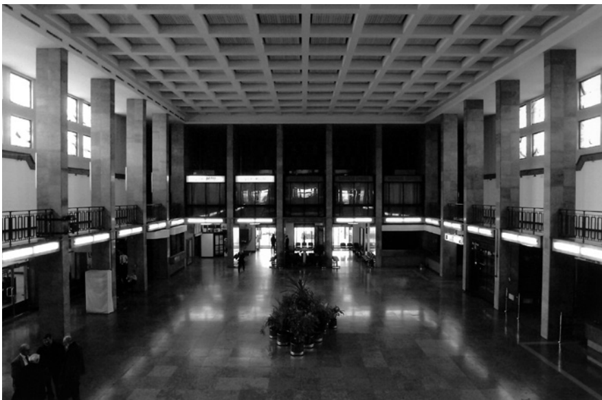
15. A Ferihegyi repülőtér 1. felvételi épülete, 2004 © MÉM MDK, Tervtár, ltsz. D 47925

pedig, ahogy említettem, egészen kiváló volt. Az ottani ácsok mesterszinten űzték a munkájukat, a kőművesek gyönyörűen vakoltak, tehát sok szempontból példát mutattak a külső kivitelezőknek. A rendszerváltás után azonban rögtön kiderült, hogy ez a tevékenység nem piacképes, tehát ha az állam nem tekinti feladatának a fenntartását, akkor az egész nem működik, mert a piac sokkal olcsóbban tudja megcsinálni mindezt, persze sokkal gyengébb minőségben is. Sajnos a hivatal azonnal feladta a kivitelezést. Ez szintén kellemetlen következménye volt a rendszerváltást követő átalakulásnak, mivel egy hatóságnak nem lehettek ilyen részlegei. Önállósodniuk kellett, úgy viszont a piacon nem tudták fenntartani magukat. Szétszéledt mindenki, aminek ma még inkább érezni az eredményét. Juan Cabello nemrég ötször bontatott vissza egy egyszerű törtkő falszakaszt Szabolcsban, hatodszorra viszont már nem kísérelte meg, mert kiderült a kőművesekről, hogy egyszerűen képtelenek megcsinálni.