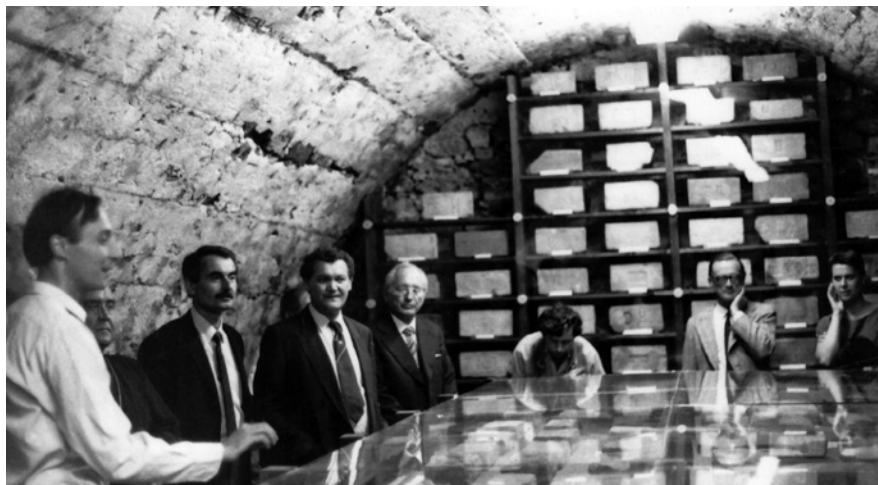
11. A Magyarországi bélyeges téglák. Dunántúl című veszprémi kiállítás megnyitója, 1986

de - ott lehettünk az új magyar műemlékvédelem születésénél. Ez Oláh Zoli egyik terve kapcsán fogalmazódott meg, amit ma is elég sikerületlennek tartok.