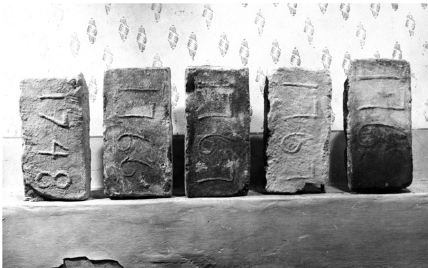
10. A győri Liszt Ferenc utca 1. szám alatti lakóház 18. századi bélyeges téglái