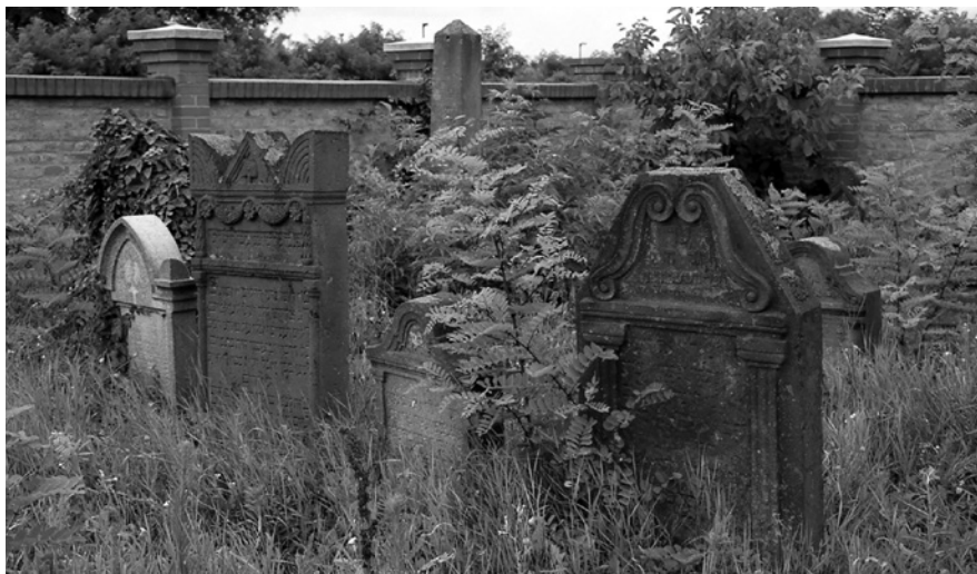
16. Tiszafüred, zsidó temető, 2004