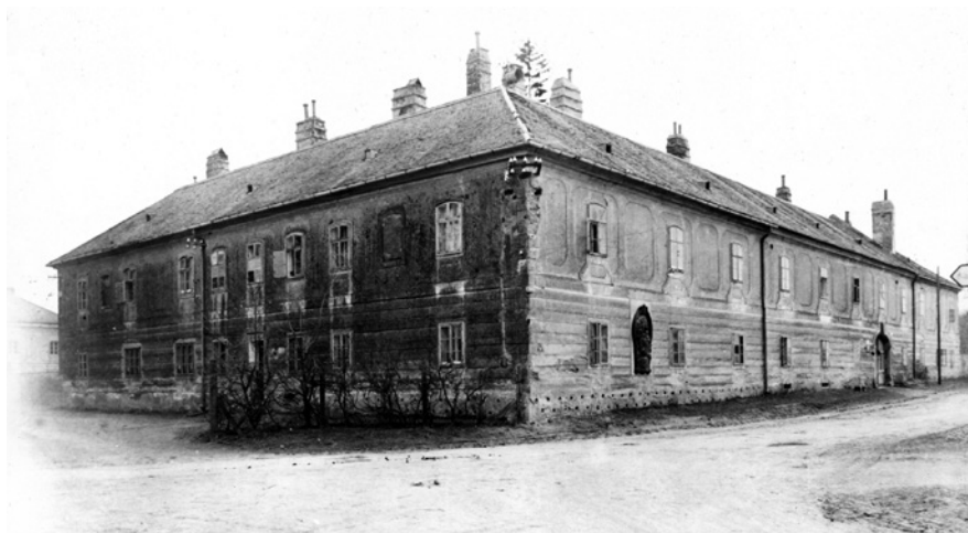
7. A fertői Muzsikaház, 1954

dokumentálásban és sok minden másban. Ugyanakkor Feri azt is megmutatta, hogyan kell a levéltárban kutatni, hogyan lehet a telekkönyvekben „mozogni”. Mindez a soproni bevezető kutatásokon kívül leginkább két helyszínen zajlott.