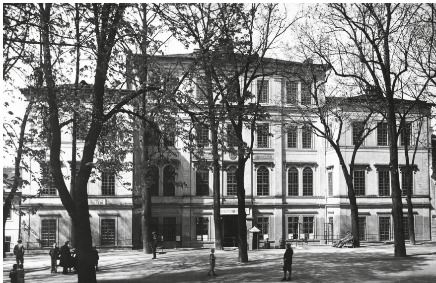
2. A korábbi beszercebányai királyi katolikus főgimnázium homlokzata 1930-ban.