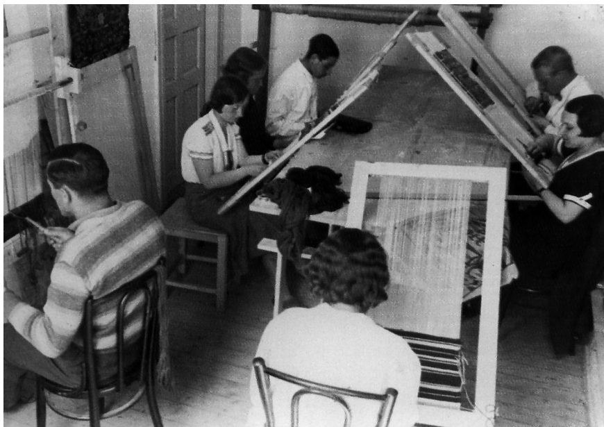
A kézimunka-terem az „Atelier” művészeti magániskolában, 1930-as évek közepe.