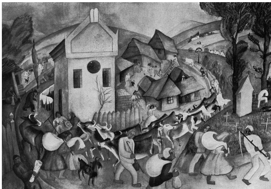
Lesznai Anna Különös falu című művének reprodukciója Berény Róbert cikkében. Fórum , 2. 1932. 263.