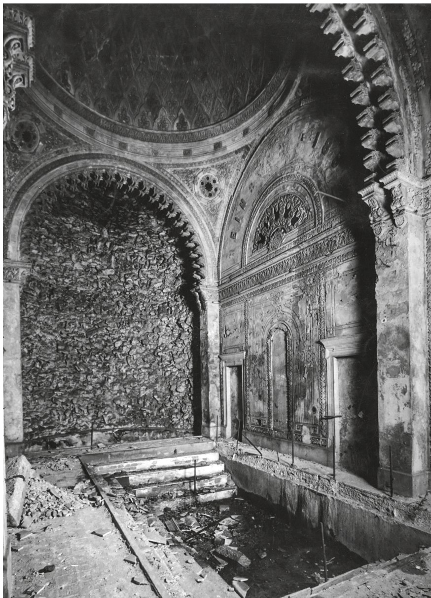
9. A Rác fürdő belső tere a török medencével és a kupolával