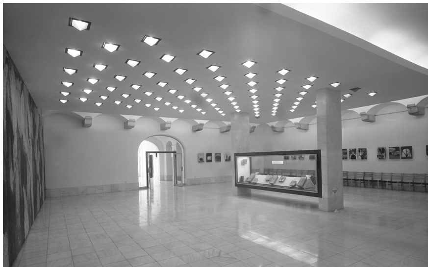
3. Az egykori OMF székház aulája