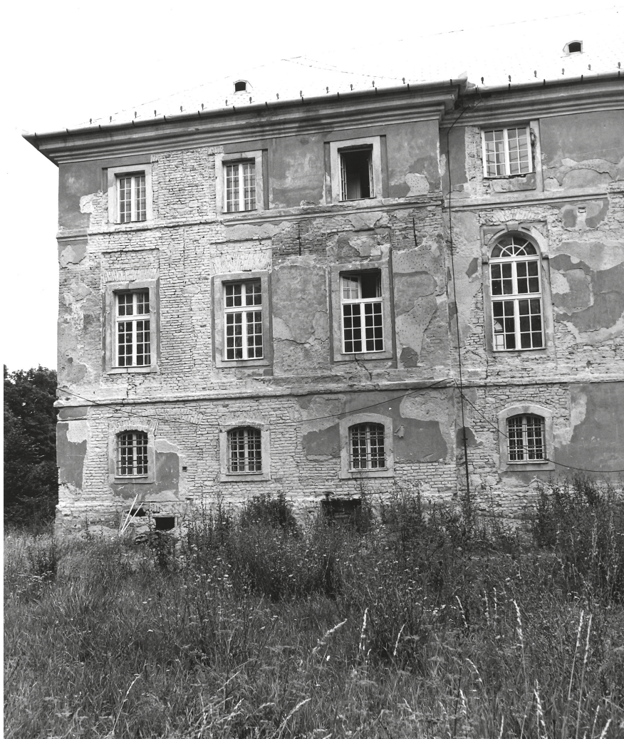
13. Bicske, Batthyány-kastély, északi rizalit, homlokzati falkutatás, 1987. © MÉM MDK, Tervtár, ltsz.: D 28098

programokat szerveztek. Az ÁMRK-ban a kollégák minden évben végigjárhatták az elkészült munkákat; a pénzügyeseket is elvitték, hogy lássák, mi történik abban az intézményben, ahol dolgoznak.