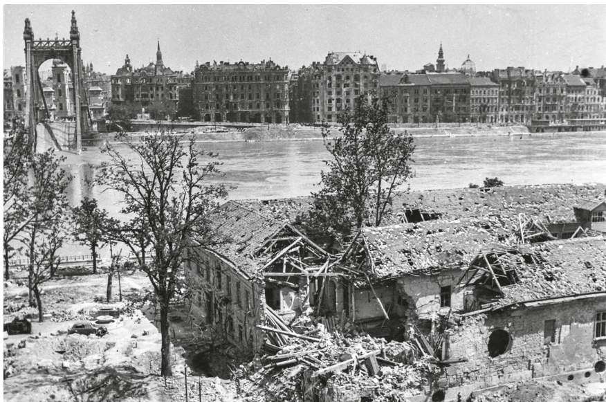
8. A Rudas fürdő épülete Budapest ostroma után, 1945.

tanulóság, és nagyon kéne vigyázni arra, hogy az emberek minden körülmények között megőrizhessék az egymáshoz való jó hozzáállást, mert azt teljesen szét is lehet verni.