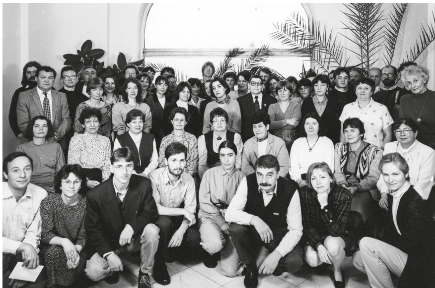
4. Az OMF és az OMvH Tudományos Osztályának munkatársai 1995-ben

FDE: Kik voltak azok a kollégák, akik meghatározók voltak számodra?