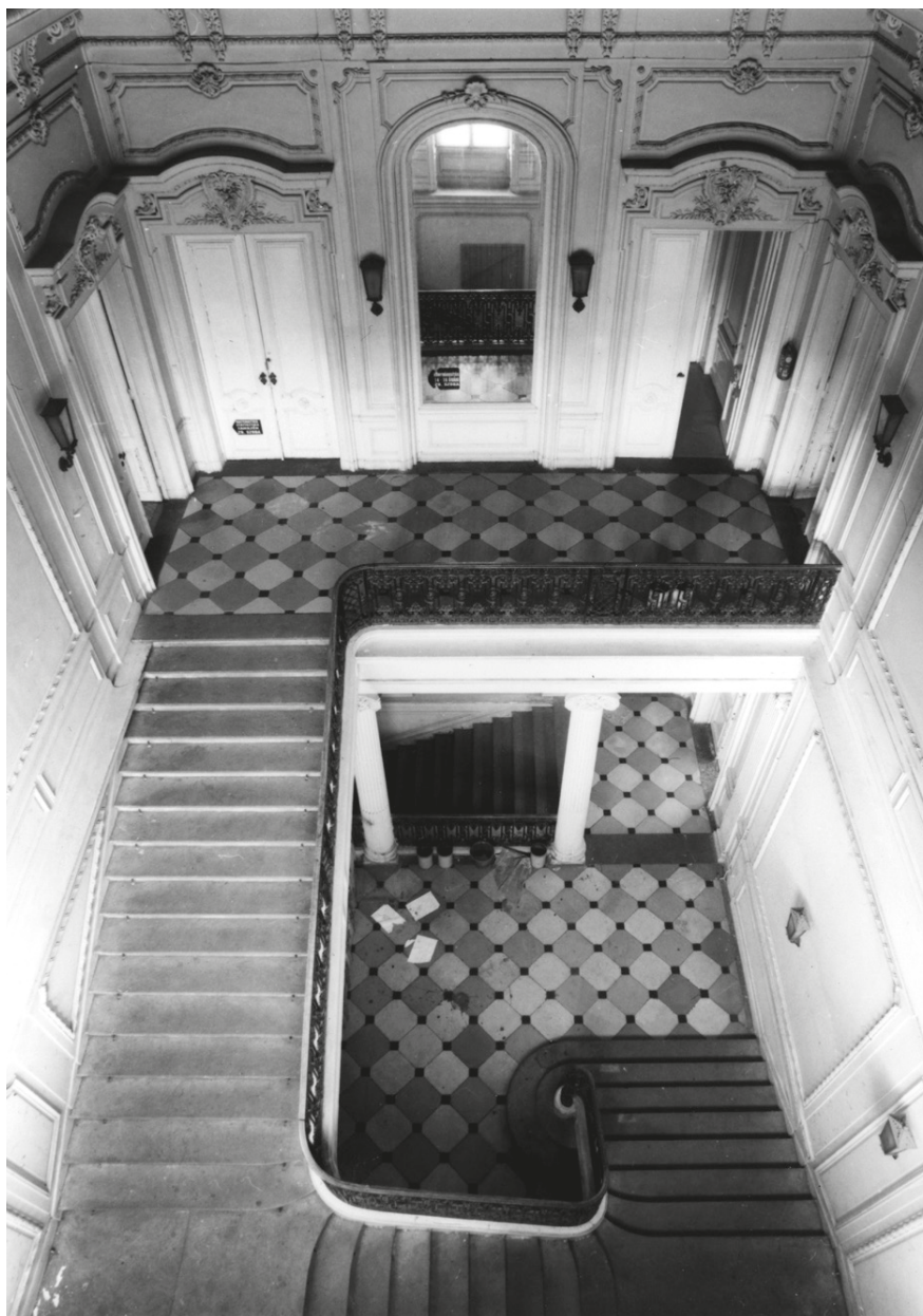
12. Budapest VIII., Festetics-palota © MÉM MDK, Fotótár, ltsz.: 191.791N