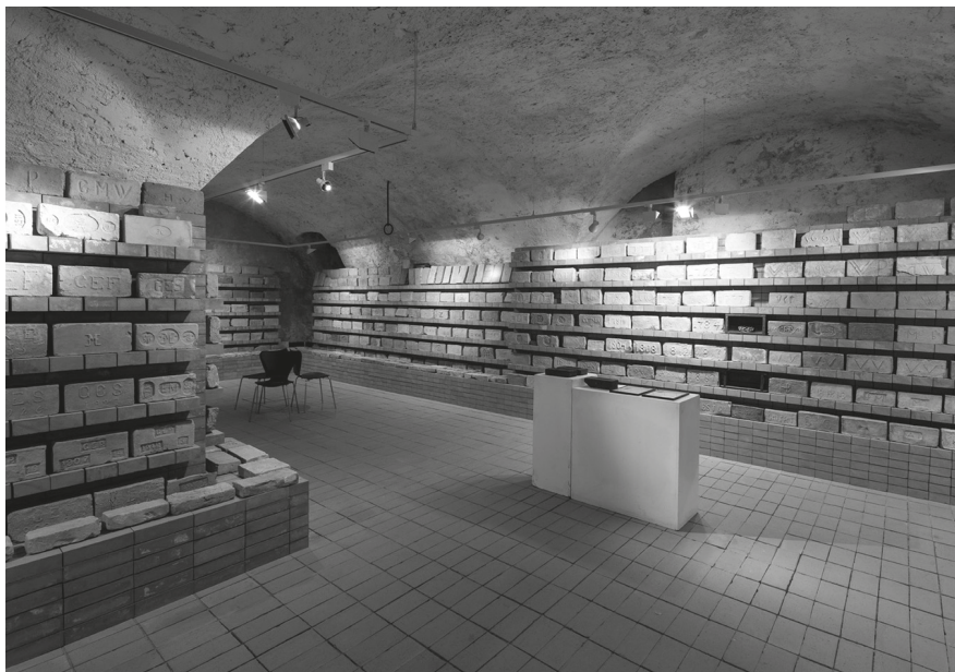
10. A veszprémi Dubniczay-házban berendezett téglamúzeum

Megnéztük, megtudtuk mindazt, amit addig senki nem láthatott, senki nem ismerhetett. Megtaláltuk az összes falicsorgót, azonosítottuk a vízvezetékrendszereket. Az itt szerzett tudást később a Császár fürdő, 36 illetve a Lukács fürdő termálrészlegeként működő egykori lőpormalom kutatásánál, 37 majd a BTM felkért konzulenseként a Rác fürdőben is kamatoztathattam. 38 Elképesztő sorozat volt, és nagyon sok haszonnal járt számomra. Hozzá kell tennem, hogy ha mindezt nem lehetett volna megcsinálni, akkor ezekben a fürdőkben a modern gépészet beépítése miatt kő kövön nem maradt volna. Bizonyos esetekben elkerülhetetlen az alapos falkutatás, ám az, hogy erre lehetőségünk nyílik-e, függ az épület funkciójától, valamint attól, hogy milyen mélységű lesz a tervezett beavatkozás.