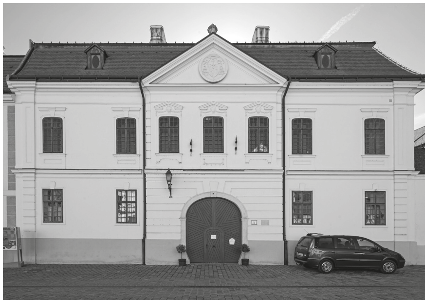
11. A veszprémi Bíró-Giczey-ház főhomlokzata © F. Tóth Gábor felvétele, 2021. MÉM MDK, Fotótár, ltsz.: 240.948D

kollégák Magyarországra jöttek, mi pedig még a Rudas fürdőn dolgoztunk, irgalmatlan mennyiségű szürke márványt szerettek volna eladni a fürdők belső felújításaihoz. Náluk ezeket az épületeket folyamatosan használják, ezért mindig megújítanak mindent, a csöveket és a burkolatokat is. Nálunk a keresztény fürdőhasználat egészen más követelményekkel járt, ennél fogva ezekhez a részletekhez kevésbé nyúltak, mi pedig megtaláltuk, kifejtettük azokat a téglaporos, hidraulikus vakolatokat, amelyeknek a színvilágát is vizsgálhattuk és rekonstruálhattuk. Hogy a fürdőkben ez milyen módon valósult meg, az a helyreállító építész elképzeléseitől is függött. Van, ami nagyon tetszik, van, amivel egyetértünk, és olyan is, amivel kevésbé. De ez egy másik történet.