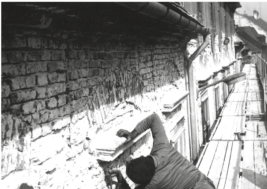
7. Sopron, Új utca 28., homlokzati falkutatás, 1975. © MÉM MDK, Tervtár, ltsz.: D 36333

KG: Milyenek láttad, illetve látod a jelenből visszatekintve az OMF nemzetközi megítélését? Úgy tűnik, mintha a magyar műemlékvédelem számára a Varsói Szerződés határai adott esetben átléphetők lettek volna.