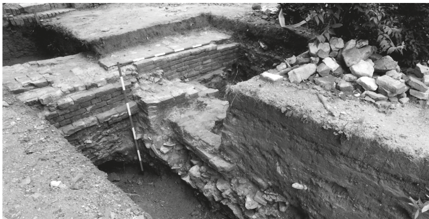
12. Kutatóárok a bátaszéki ciszterci apátság ásatása során, 1994. © MÉM MDK, Tervtár, ltsz. D 36604

a malomkerék ott, ahol a helyét megtaláltam. Végül minden adatot összegyűjtve megírtam Pásztó középkori monográfiáját, amely egy tekintélyes méretű könyv formájában az Önkormányzat költségén 2018-ban megjelent. 32