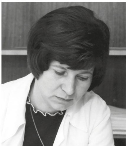
18. H. Vladár Ágnes © MÉM MDK, Tudományos Irrattár, Lymbus, ltsz. K 1899

csontból mindent meg tudott állapítani kémiai-szerológiai módszerekkel. Sajnos 1992-ben meghalt egy autóbalesetben, és magával vitte ezt a tudást, amit nem tudott átadni senkinek. Azóta persze sokat fejlődött a genetika. Ő állapította meg, hogy a pap-sokai sírban nyugvó egy fiatal férfi volt, B vércsoportú, és körülbelül huszonnégy éves korában halt meg. A tihanyi alapítólevél 1055-ben említ egy aranyozott réz körmeneti keresztet hegyikristállyal. Természetesen nem állítom, hogy arról van szó, amit megtaláltunk, mindenesetre ebben az időben használatosak voltak az ilyen jellegű darabok. Nem akárki volt, akinek ezt