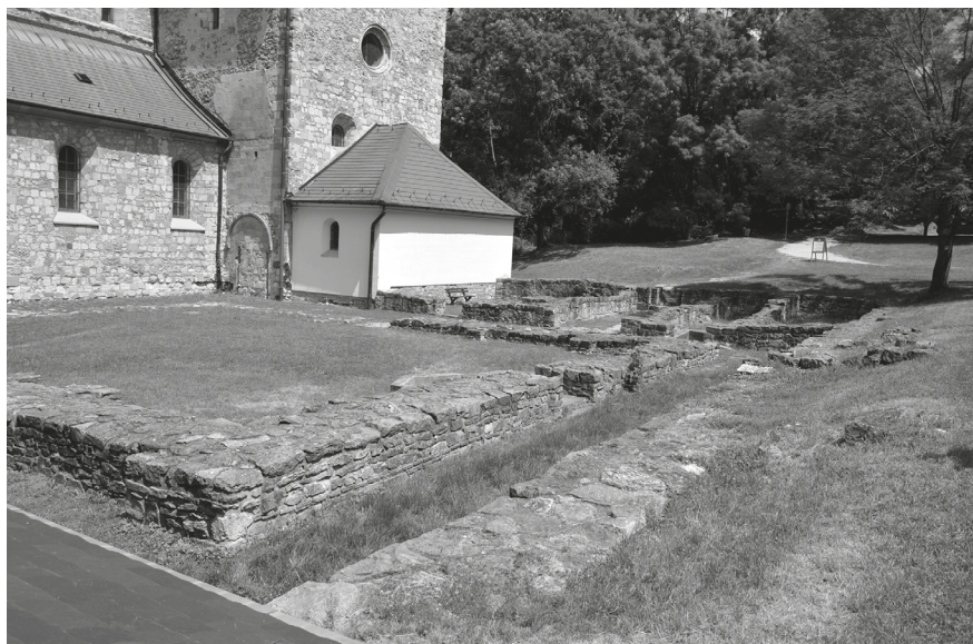
7. A bélapátfalvi ciszterci apátság romjai © Kovács Gergely felvétele, 2021.