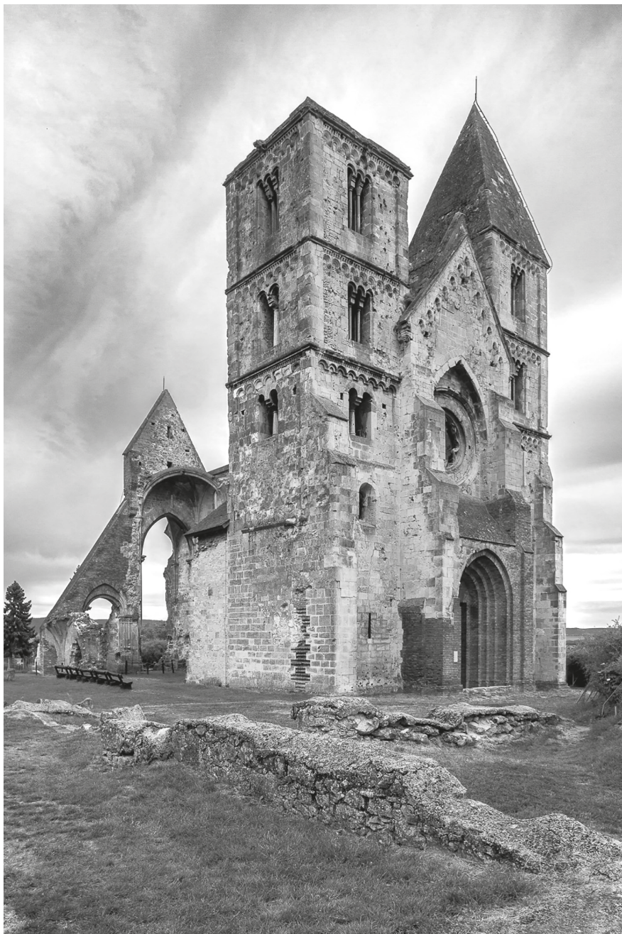
21. A zsámbéki templomrom északnyugat felől