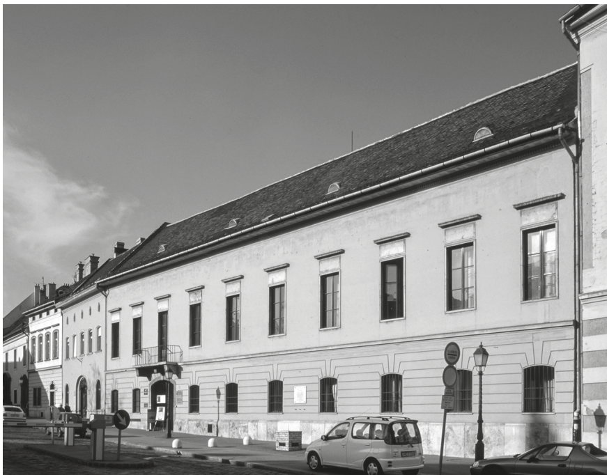
3. Budapest I., Dísz tér 4–5., főhomlokzat, az OMF első vári székháza.

sőt egy műemlékes régész műhelyt hozott létre. Főleg lányok dolgoztunk ott, pedig Gézáról lehetett tudni, hogy nem annyira bízik a női munkaerőben. Nekem is ezt mondta a beszélgetés végén: