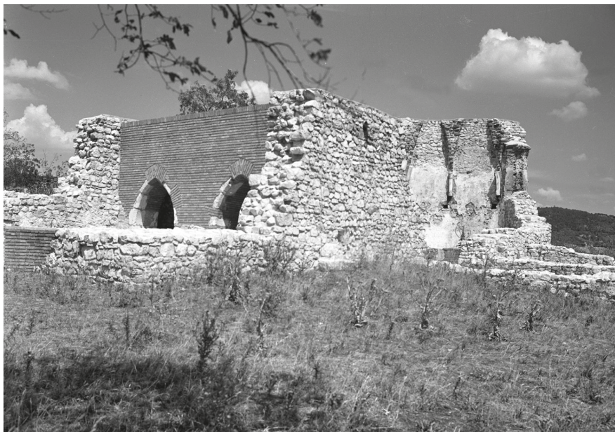
17. A papsokai templomrom a helyreállítás után © Dobos Lajos felvétele, 1968. MÉM MDK, Fotótár, ltsz. 085.765N

alkalmával már az első évben óriási szerencsém volt a központi, nagy kutatóárokban, az oltár előtt. Gimnazista gyerekekkel dolgoztam, mert más nem nagyon volt (két nyugdíjas volt még mellettünk). Egyszer csak a legügyesebb, egyben – hogy finoman mondjam – legélénkebb srác, aki a főoltár előtt kezdett el bontani egy sírt, szólt nekem. Odamentem megnézni, és azt mondta: