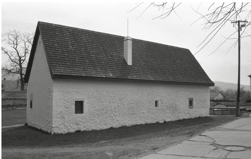
10. A pásztói Oskolamester-ház a helyreállítást követően