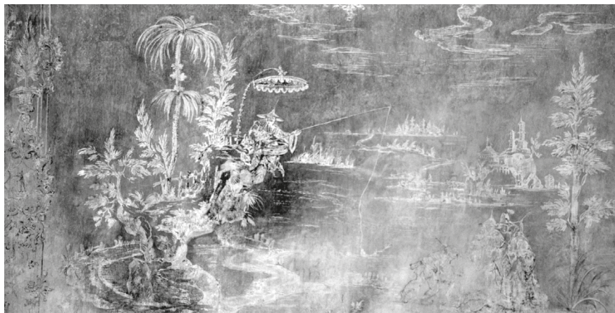
8. Részlet a hercegi előszoba északi falának negatívban fennmaradt chinosiserie falfestéséről, 2023.

és mixtion aranyozás került, az ajtók hibásan, mindkét szárnyra felszerelt rúdzárjait pedig kijavították és a fém lakatosszerkezeteket is felújították. 40