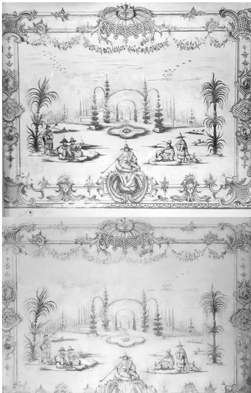
6. A hercegi sarokszalon északi falát borító chinoiserie falfestés restaurálás előtt (fent) és után (lent), 2021–2022. © Tóth Áron