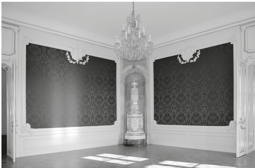
5. Az Albert szász-tescheni lakosztály hálószobája egy kályharekonstrukcióval, 2022.

kerüljenek az eredeti helyükre, a többi boiserie-maradvány pedig kiállítási tárgyként bekerült az új állandó kiállításba. 32