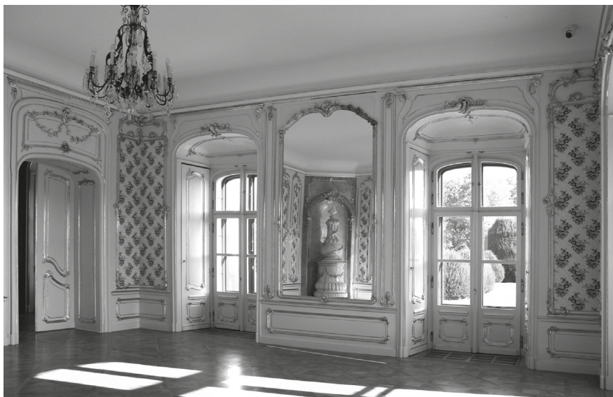
2. A rekonstruált hercegnői sarokszalon, 2022.

és az elkorhadt csapos gerendafödémeket vasbeton szerkezetekre cserélték ki. A faszervezetek mintegy nyolcvan százalékos felújításra szorultak. Ott, ahol meg lehetett őrizni a korábbi nyílászárók és fa falburkolatok, boiserie-k maradványait, újonnan faragott, de részleteikben az eredetitől némileg eltérő szerkezetekbe építették be őket. A színeket tompították, a megmaradt aranyozást tisztították, de új aranyozás helyett az aranyozandó felületeket csak okker színű krétával vonták be. A többi helyiséget egyszerűen bevakolták. 11 A nyílászárókra bronzöntvényeket, illetve bronzszínű fémszerkezeteket szereltek fel sokkal díszesebb és részletgazdagabb formákkal, mint amilyenek az eredeti fémszerkezetek voltak. Ráadásul a kétszárnyú ajtók rúdzárjait hibásan alakították ki: mindkét ajtószárnyra felszerelték őket. 12 A földszinten a hercegi lakosztály előszobáját, valamint a hercegnői lakosztály sarokszalonját és hálószobáját, továbbá az emeleten a Mária Terézia-lakosztály előszobáját boiserie-be foglalt textiltapétával burkolták. 13 Ezeknek a