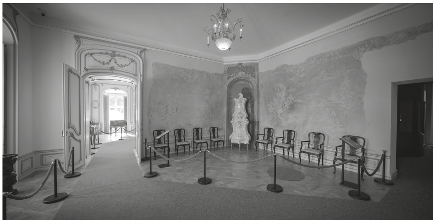
7. A hercegi előszoba 2017-ben feltárt chinoiserie falképeinek bemutatása, 2023. © Pazirik Kft.