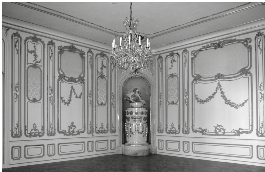
4. A restaurált hercegi háló, 2022.