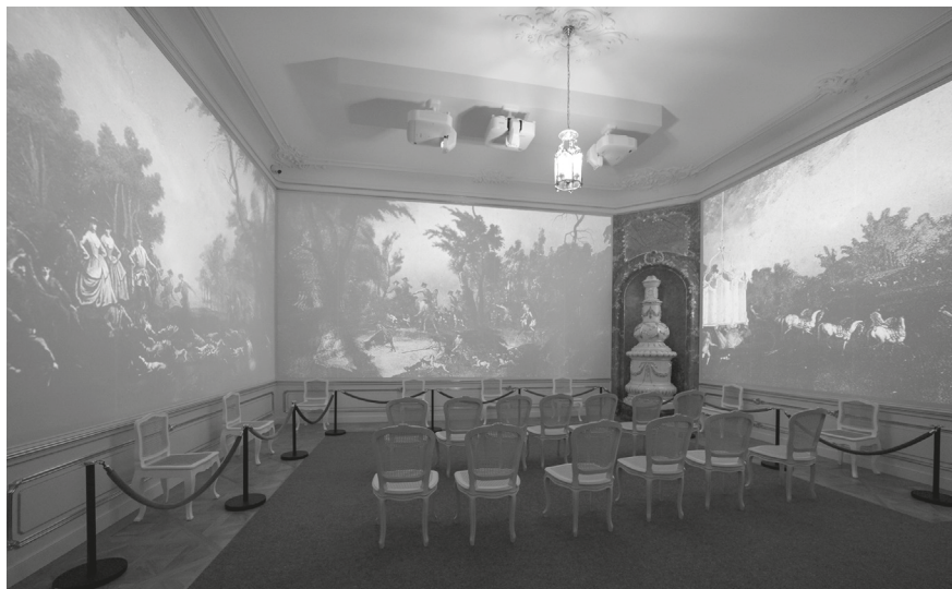
3. A Mária Terézia lakosztály előszobája: rekonstruált boiserie és az elpusztult, falkavadászatot ábrázoló pannókat felidézõ vetítés, 2023.

feltárták a díszítõfestést. 19 A szilikátrestaurátori kutatások a homlokzati nyílászárófülkék stukkói, a kályhafülkék, valamint a párkányok eredeti részleteinek és kiegészítéseinek a viszonyát tisztázták. 20 A kályhákat már korábban felmérték és eredeti helyüket lokalizálták, ezt a felmérést most aktualizálták. 21 A 2017-ben végzett farestaurátori kutatásokat 2021-ben, a felújítások elkezdése elõtt még kiegészítették, hogy pontosan elkülönítsék a nyílászárók és a boiserie-k 18. századi, illetve 20. századi részleteit. 22