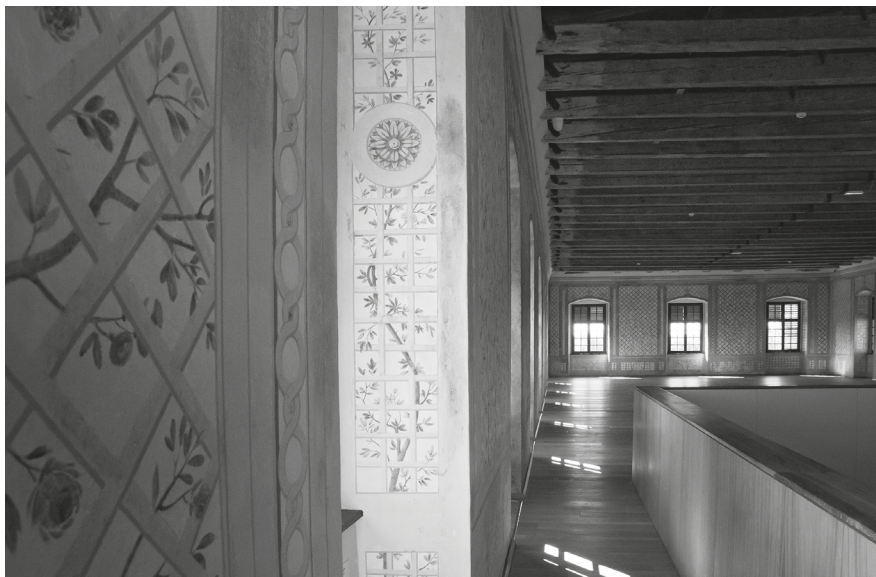
11. Részlet a belvedere restaurált falfestéséről, 2023. © Eszterháza Központ

A hercegi lakosztály előszobájának északi és nyugati falán 2017-ben feltárt kék-fehér chinoiserie szekő restaurálása eltért a korábbiaktól. A kép eredetileg törtfehér alapfelülete ugyanis olyan mértékben elszennyeződött, hogy a koszréteget nem lehetett eltávolítani, hanem csak enyhíteni lehetett rajta. A tisztítás ezért nem tárta fel az eredeti színezést. A 18. században az alakok megrajzolásához kétféle kék színt használtak, amiből a világosabb elpusztult, kipergett, helyét csak a koszréteg körvonala őrízte meg. A sötétebb kék szín is nagyon megkopott. A falfestés ennek következményeként mintegy negatív képként maradt fenn. A restaurálás célja a lehetőségekből kiindulva az volt, hogy a hiányok okozta zűrzavart megszüntessék és létrehozzanak egy értelmezhető, egységes felületet. A háttér egységesítését temperával és akvarellal végezték el, a figurákat viszont – minimálisan – pasztellel egészítették ki, ami biztosította a reverzibilitást. A festés így kopottságában látható, ami a negatív formákkal együtt maradandó esztétikai élményt nyújt. 53