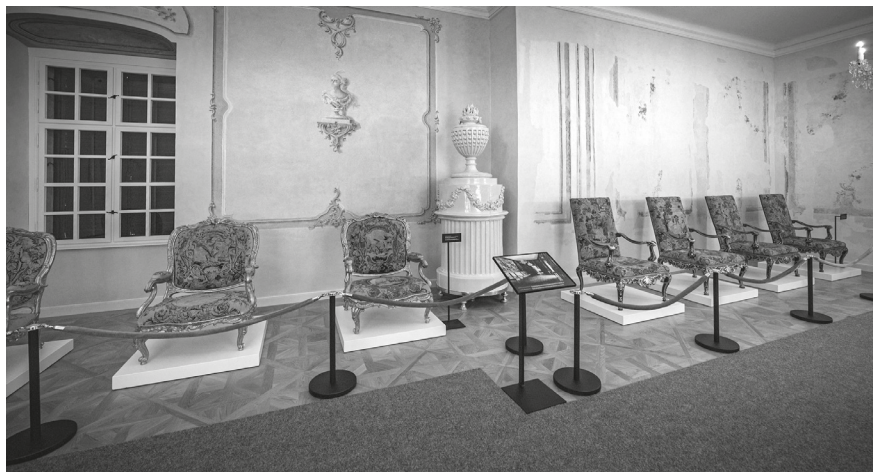
10. Három falfestés-periódus bemutatása az Albert szász-tescheni hercegi lakosztály északi traktusának előterében, 2023.

Fel szeretném hívni rá a figyelmet, hogy a kiállítási szövegek minden alkalommal tájékoztatják a látogatókat, ha rekonstrukciót, vagy 20. századi elemet látnak.