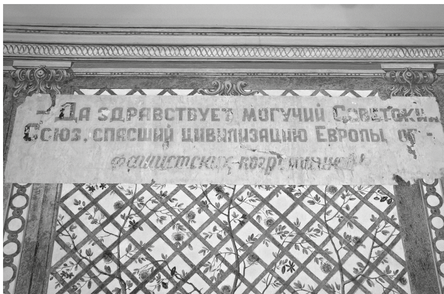
12. Orosz felirat 1944–45-ből a belvedere falán, 2023.

Az Albert szász-tescheni hercegi lakosztály északi traktusának előterében három 18. századi falfestés-réteg került elő. A legalsó, rózsaszínes összhatású, női büsztöket ábrázoló réteg a középrész átellenes oldalán, a Mária Terézia-lakosztály porcelánzórájában látható festéssel analóg. A második, zöldes színvilágú, virágfüzérékből álló réteg a főlépcsőház falfestésével azonos. A legfelső réteg világos, zöldes alapszínű faltükrök-ből és zöld babérlevélből komponált keretezésből áll. A helyiségben mindegyik réteg töredékes megőrzésére lehetőség nyílt. Mivel a szoba keleti részén a legalsó rétegből maradt fenn nagyobb összefüggő felület, ott azt lehetett bemutatni, a két felső réteg pedig a nyugati részen látható. 55 Az előtérből nyíló kis szobában a legalsó és a második réteg maradt fenn. Mivel itt a második réteg sokkal nagyobb területeken megvolt, mint az alsó, továbbá a szomszédos helyiségben az alsó réteg látható, az a döntés született, hogy a második réteget ki lehet retusálni, az alsó réteget pedig helyenként, kutatóablakokon keresztül lehet bemutatni. 56