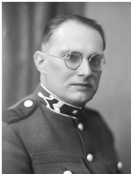
Wilde Ferenc 1918 körül