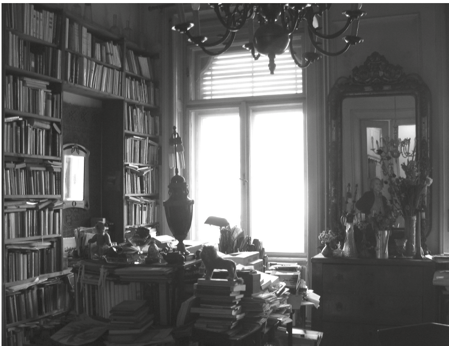
4. Széphelyi F. György lakásának dolgozószobája, Ferenciek tere 2., 2010